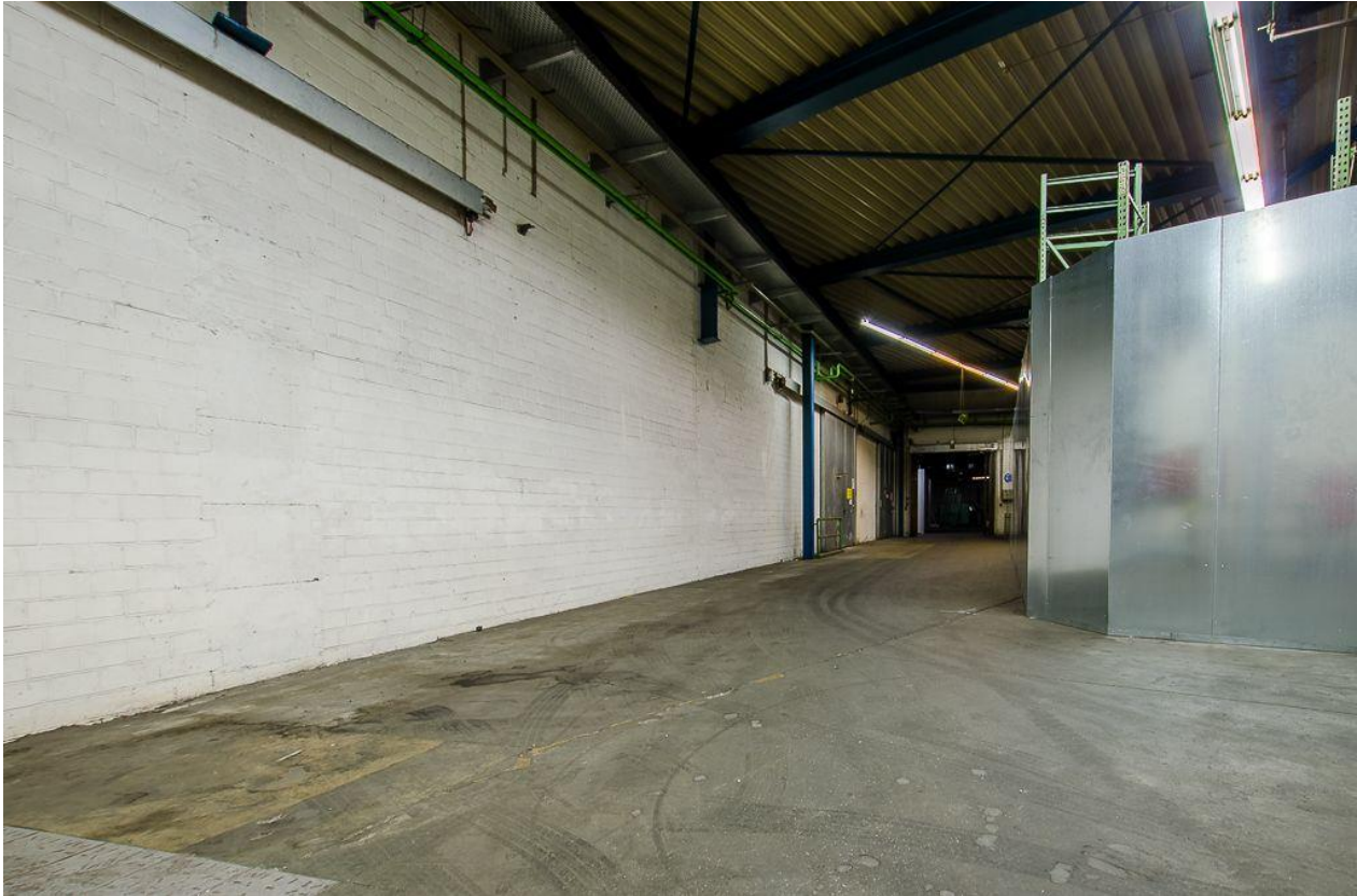
Zuwegung innerhalb des Gebäudes