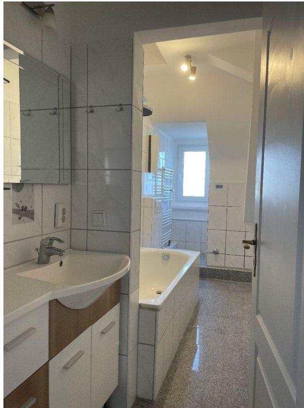
Bad mit Fenster