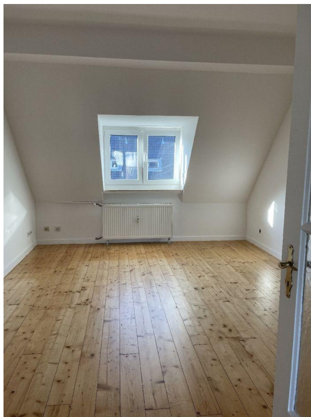
Schlafzimmer / Kinderzimmer