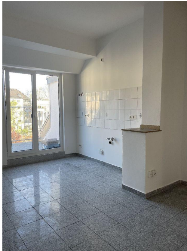
Wohnküche Zugang Balkon