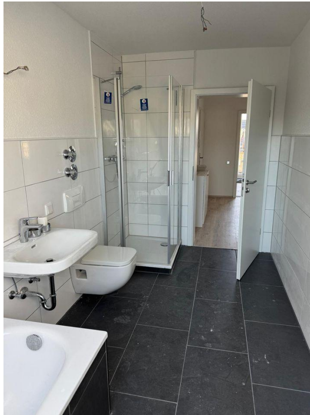
Bad mit Dusche ...