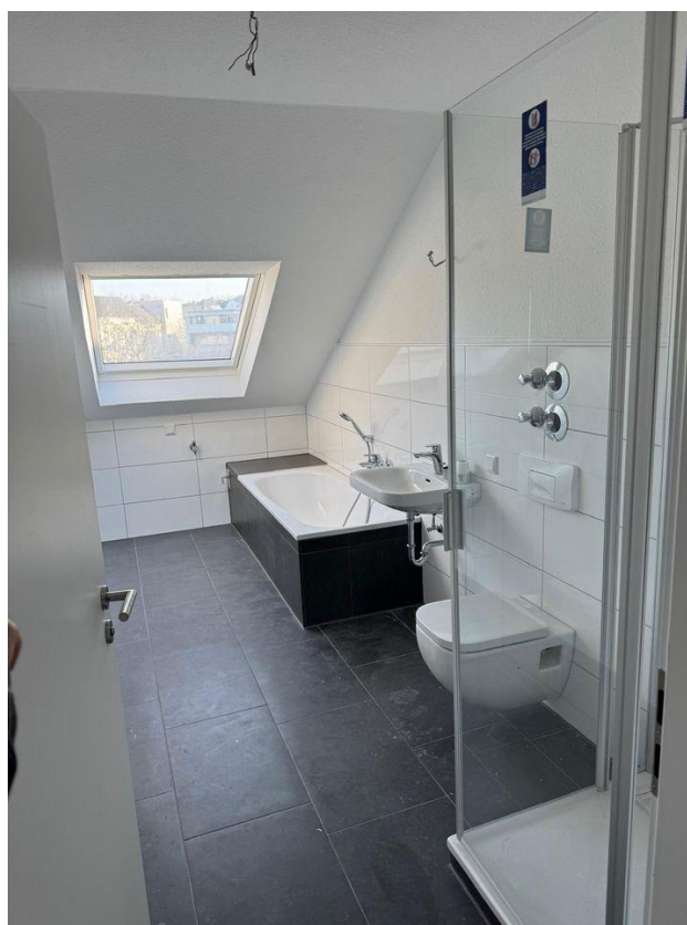
... und Wanne