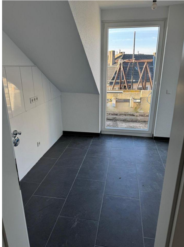
Küche mit Ausgang zum Balkon