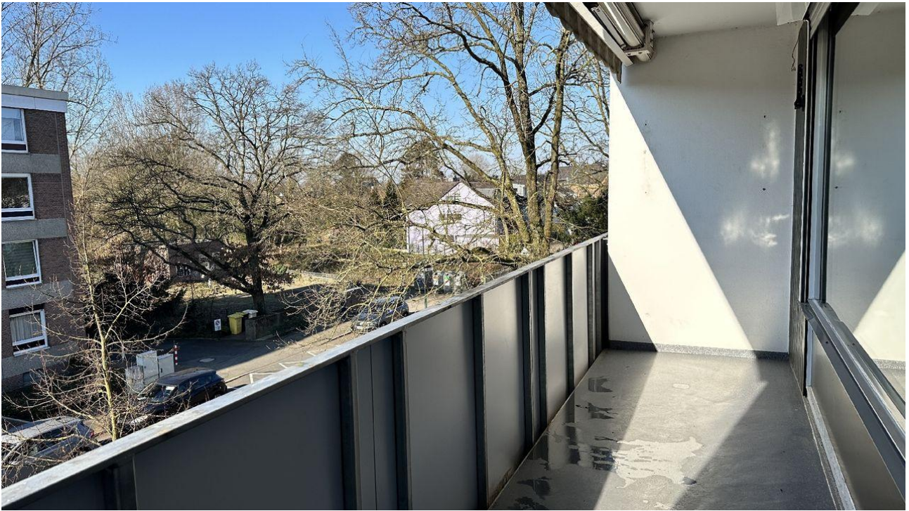
Balkon / Loggia