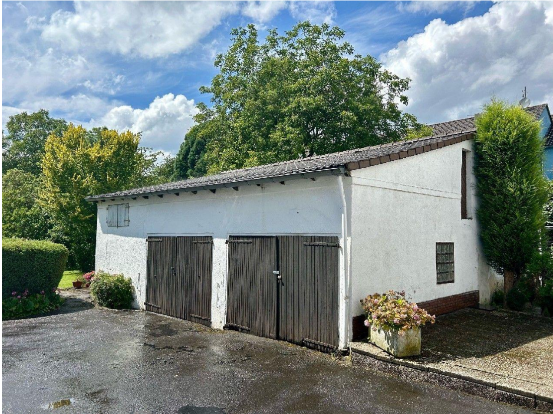
Doppelgarage mit Zufahrt