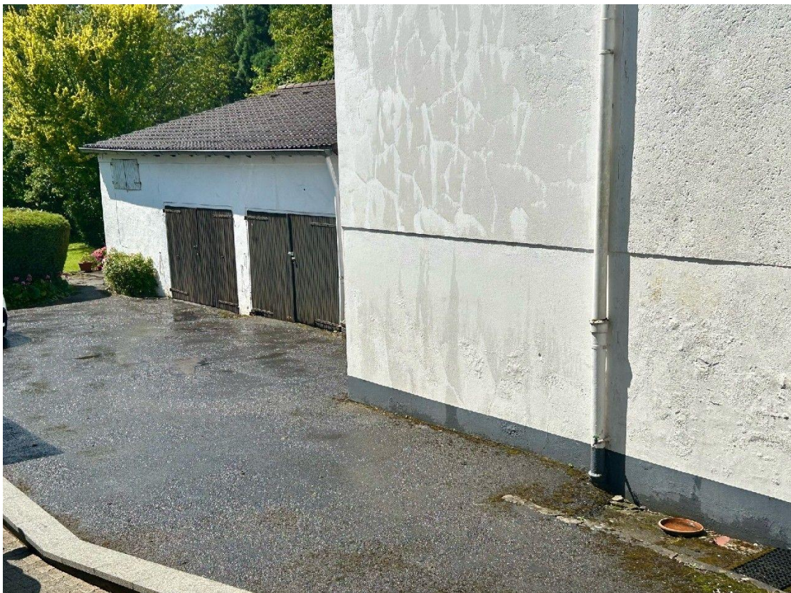
Hofzufahrt zur Garage