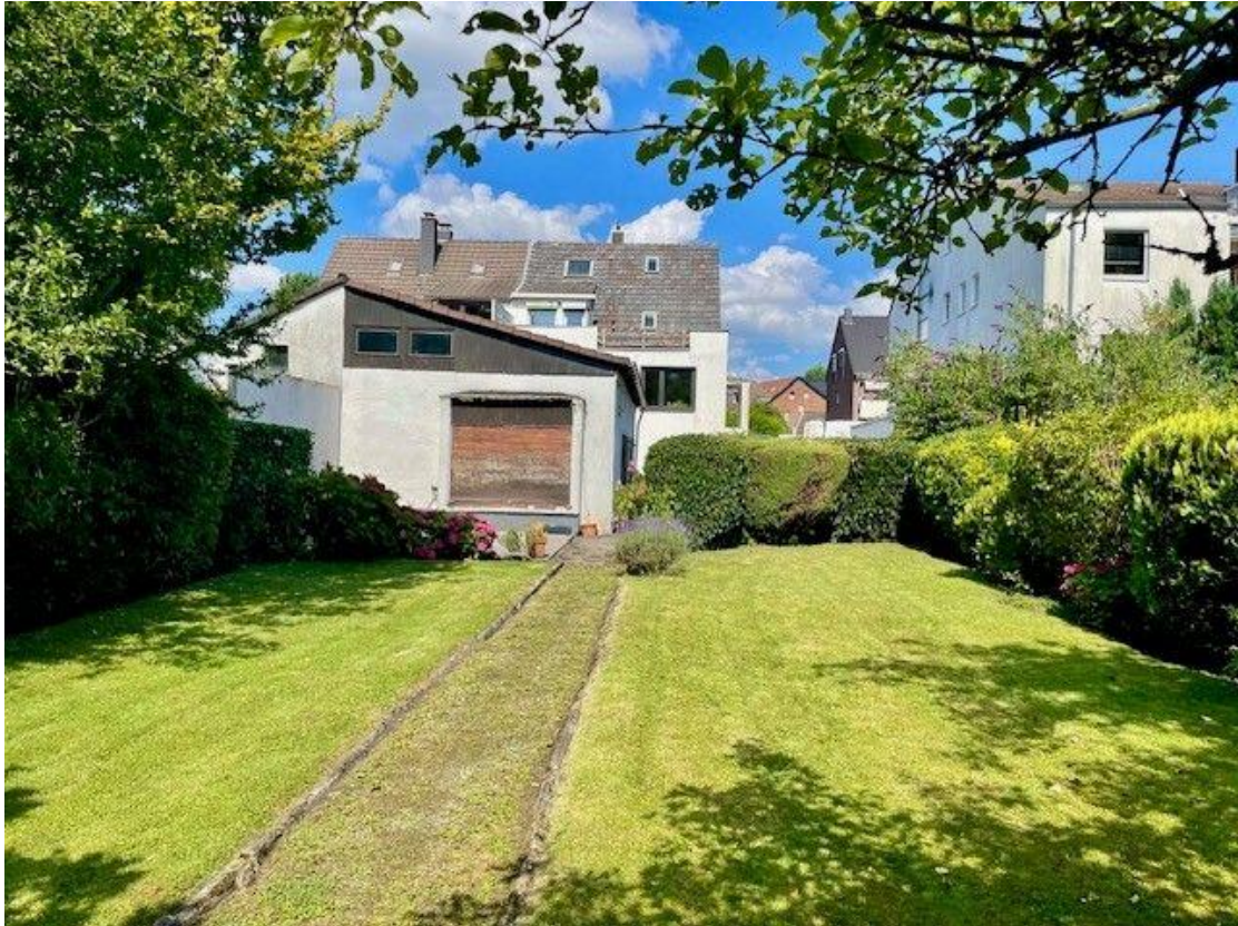
Ansicht mit Wirtschaftsgebäude/Garage