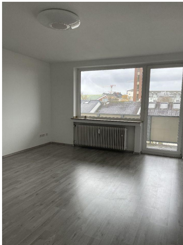
Wohnen mit Balkon