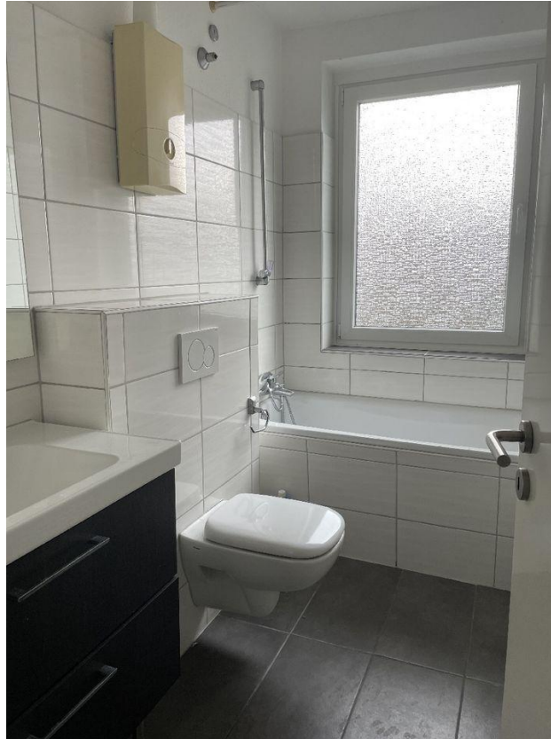
Wannenbad mit Fenster