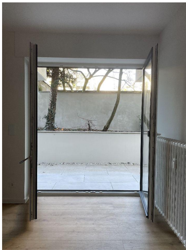
Flügel Tür zum Garten