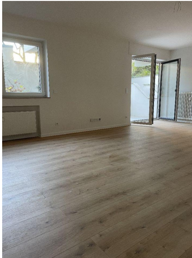
heller Raum mit elektrischen Rollläden