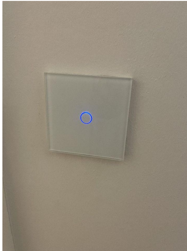
exklusive Schalter (touch)