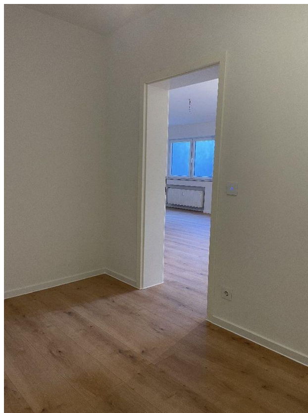
Blick ins Wohnzimmer