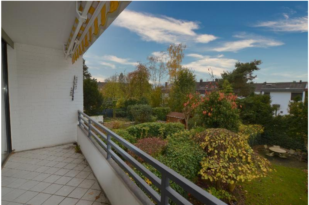
Balkom am Schlafzimmer