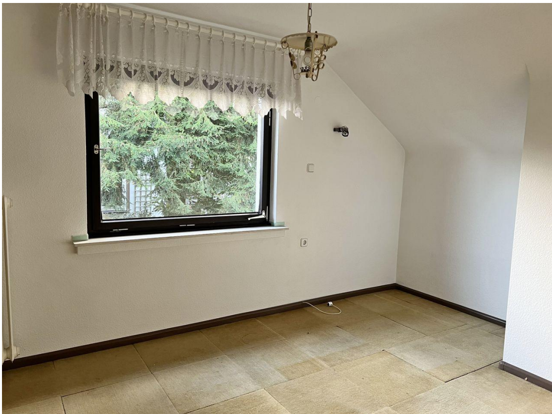
DG Zimmer 2