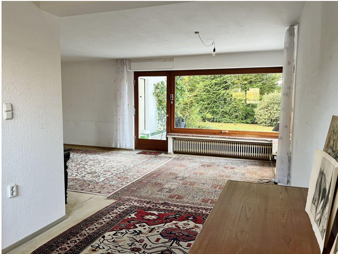
Essbereich u Wohnzimmer