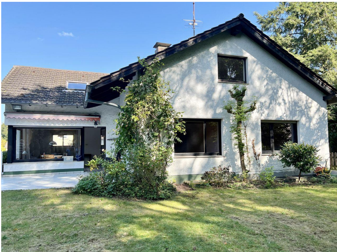
Rückansicht mit Terrasse