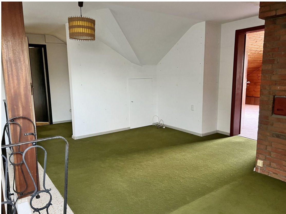
Diele im DG