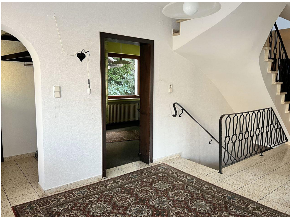
Diele im EG