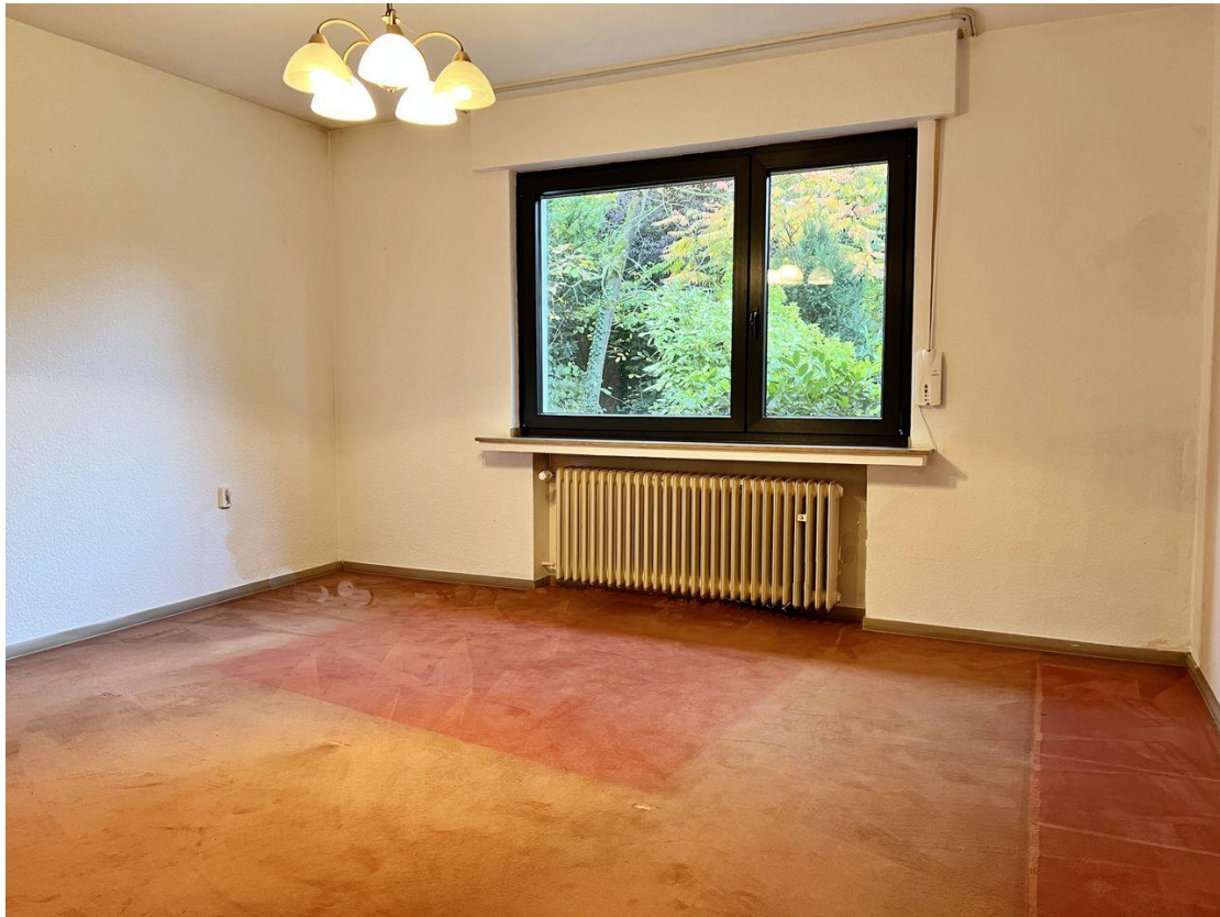
EG Zimmer 4