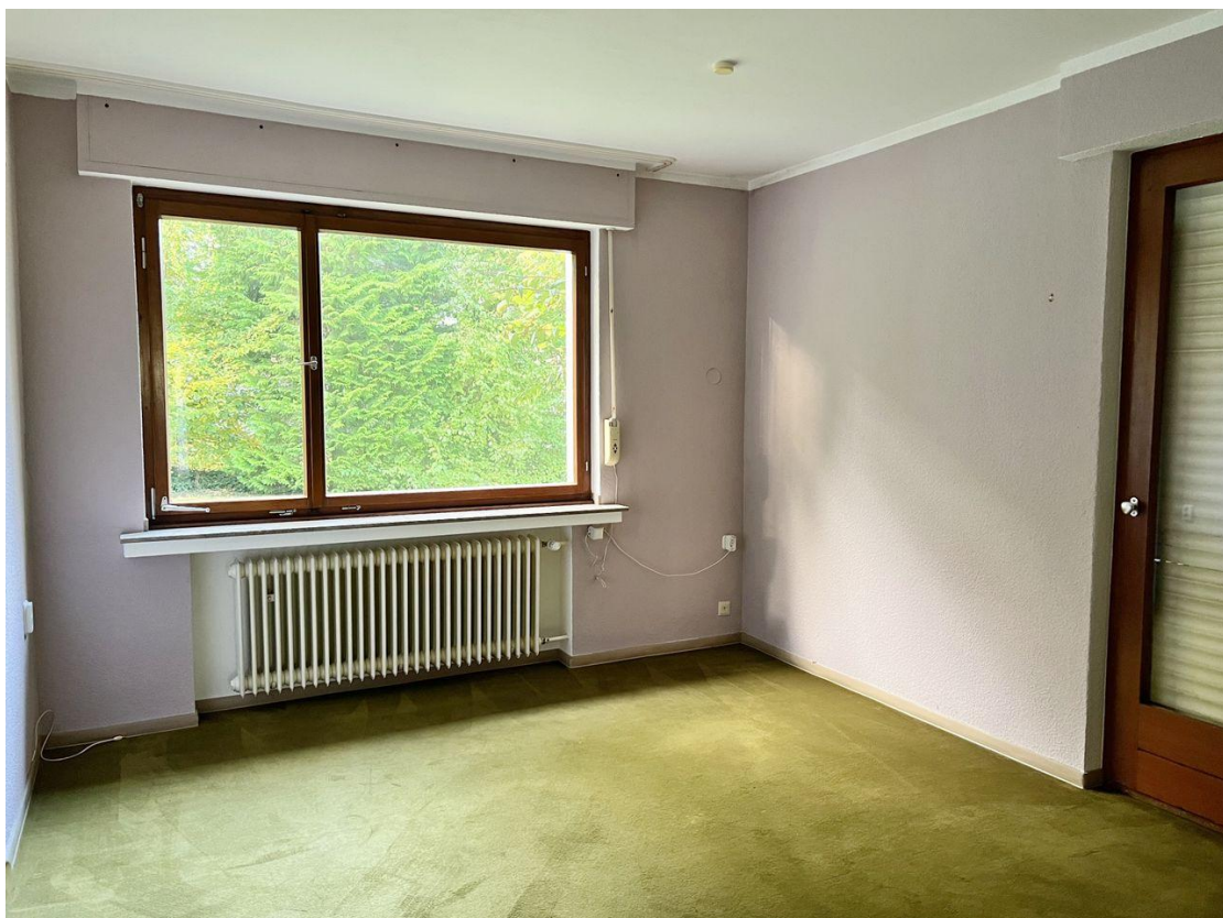
EG Zimmer 3