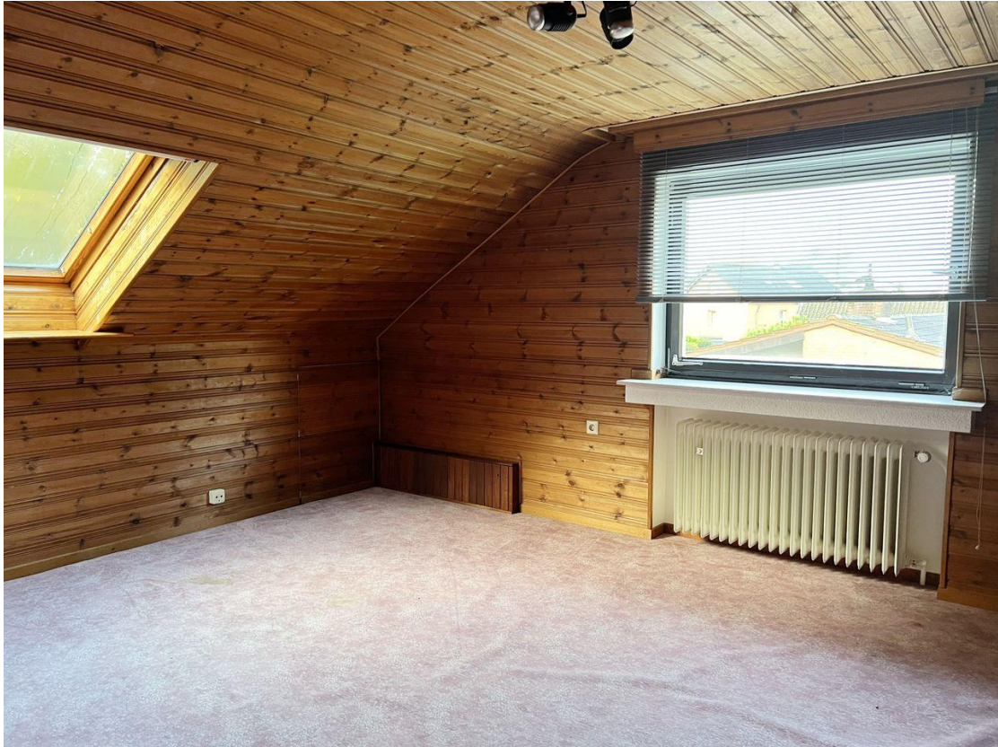
DG Zimmer 1