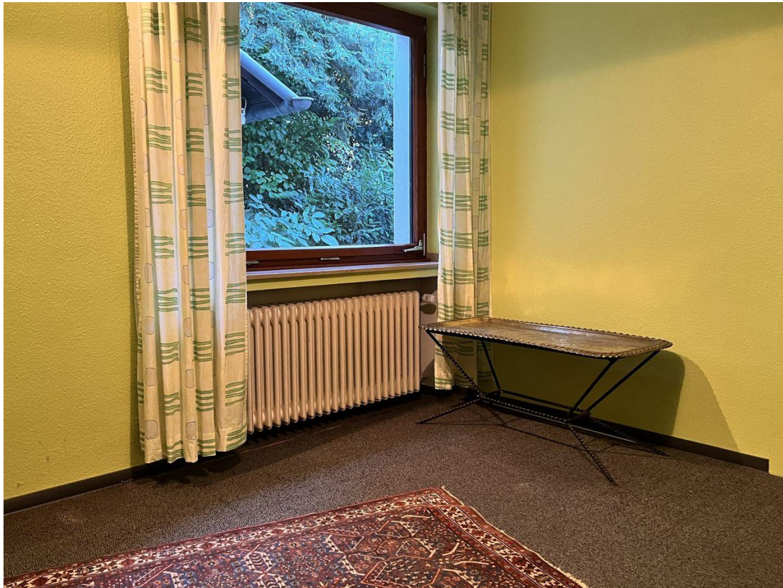
EG Zimmer 2