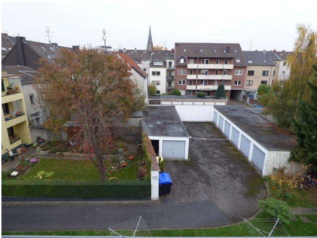
Blick in den Hof mit Garagen