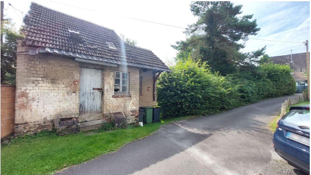
Straßenansicht Grundstück mit Backes