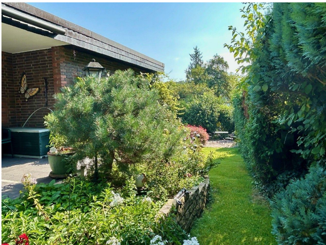
Terrasse mit Zugang zum Garten