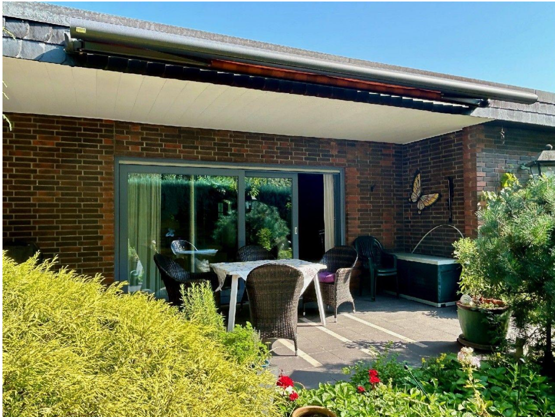
Terrasse mit Markise