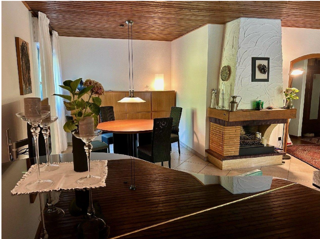
Blick zum Kamin und Essbereich