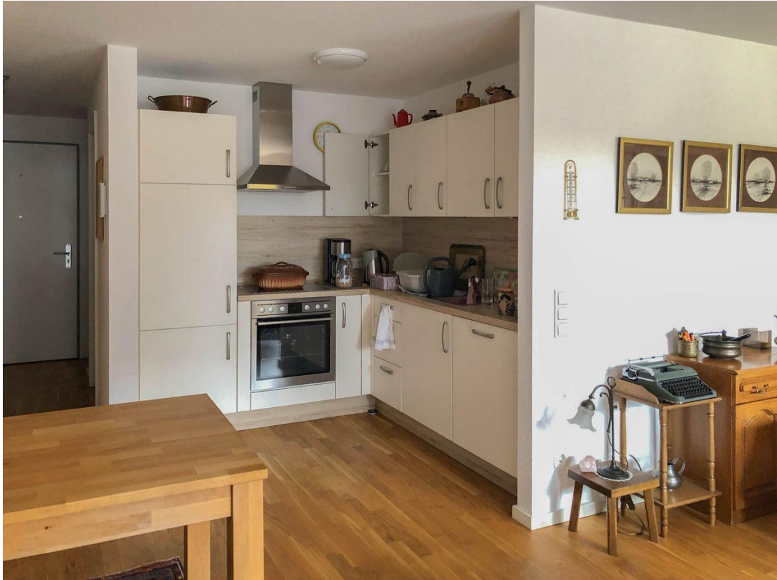
Wohnbereich mit Küche