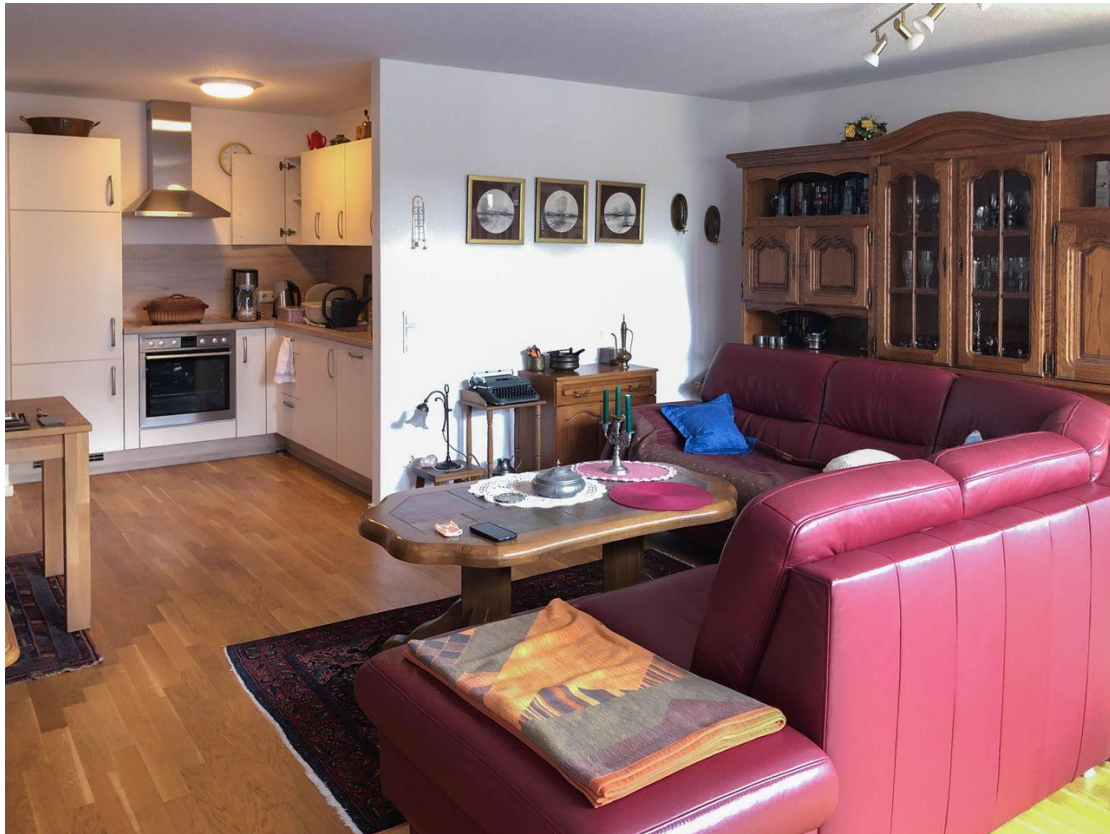
Wohnbereich mit Küche und Balkonzugang