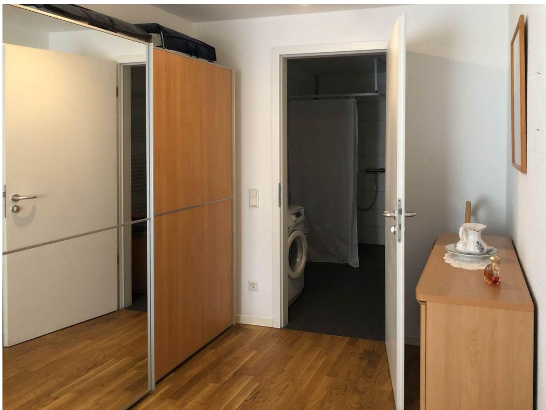
Schlafzimmer mit Zugang ins Bad