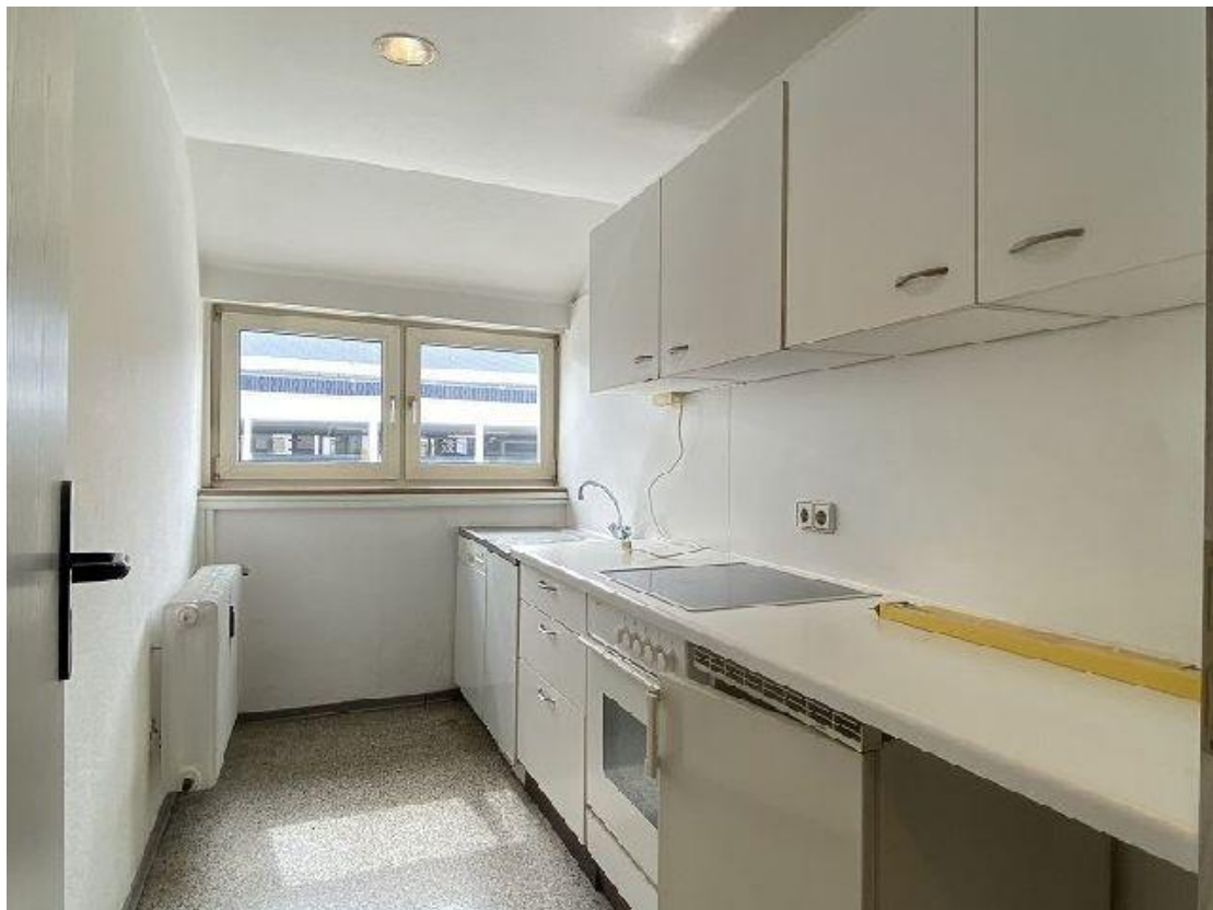
Küche 3. OG