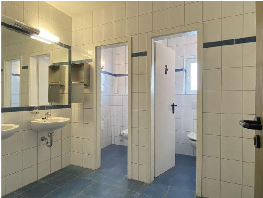
Sanitäreinrichtungen 1.OG Flügel