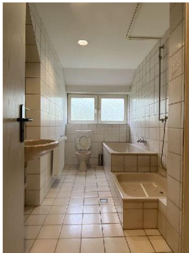
Vollbad 3. OG