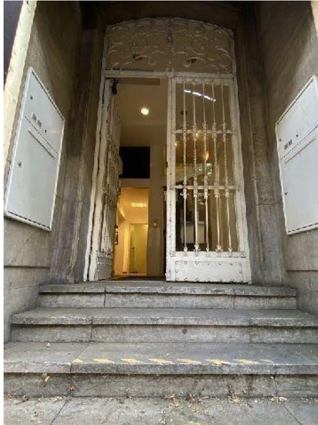
Eingang mit Automatiktür