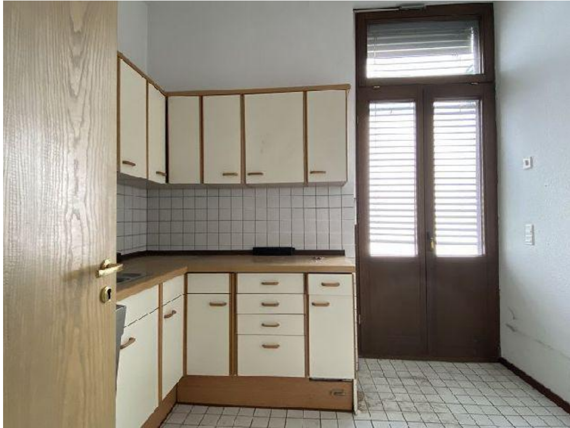
Teeküche 1. OG Flügel