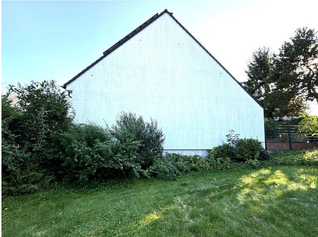
Blick zum Nachbarhaus