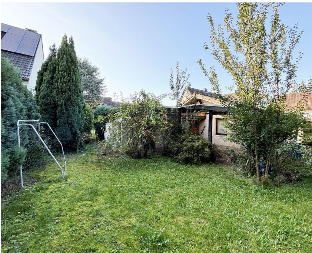
Abzureißendes Gebäude im hinteren Bereich