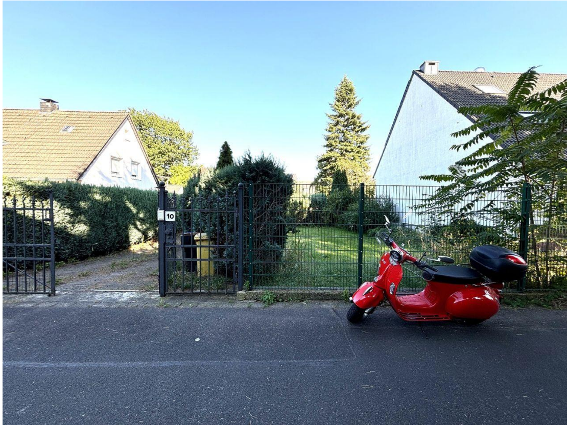
Blick auf das Grundstück von der Straße