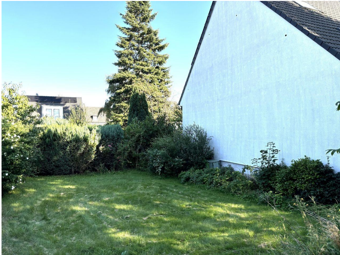
Grundstücksteil Wiese Blick zum Nachbarhaus