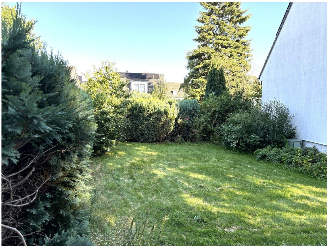
Grundstücksblick Richtung Südost