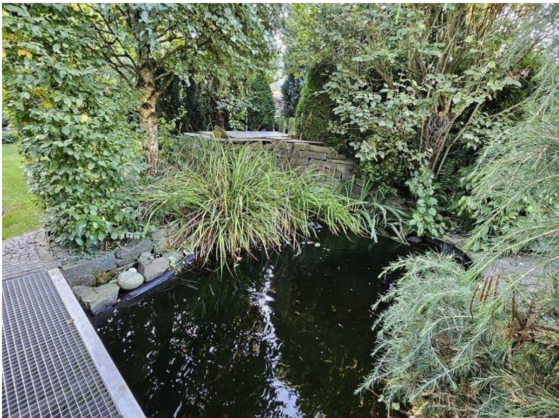
Garten / Teichanlage