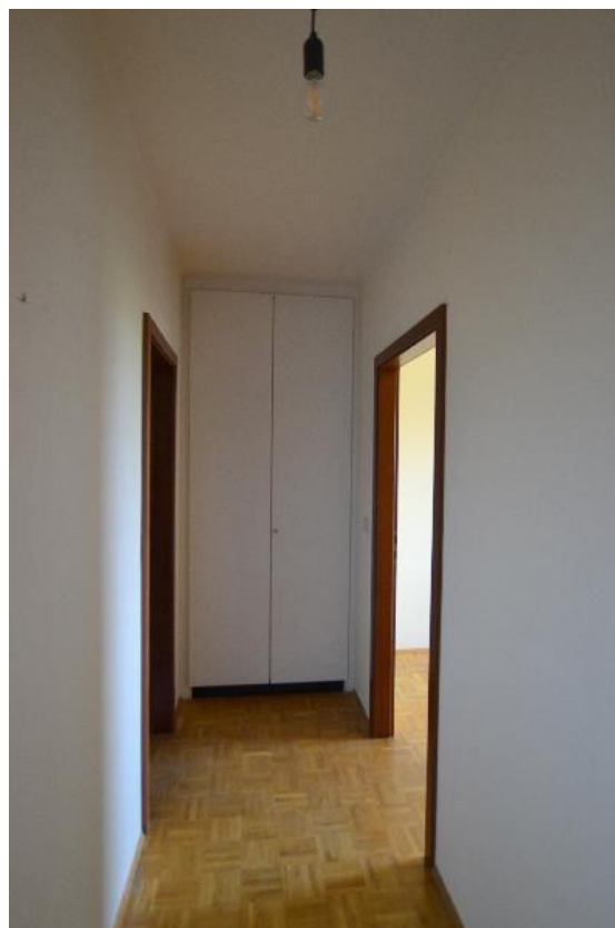
Diele mit Abstellschrank