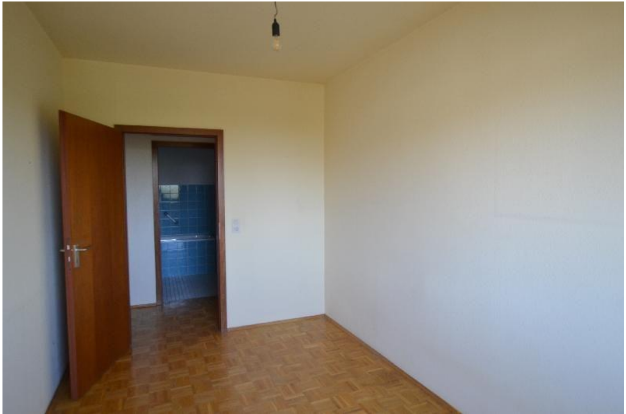
Kinder- oder Arbeitszimmer