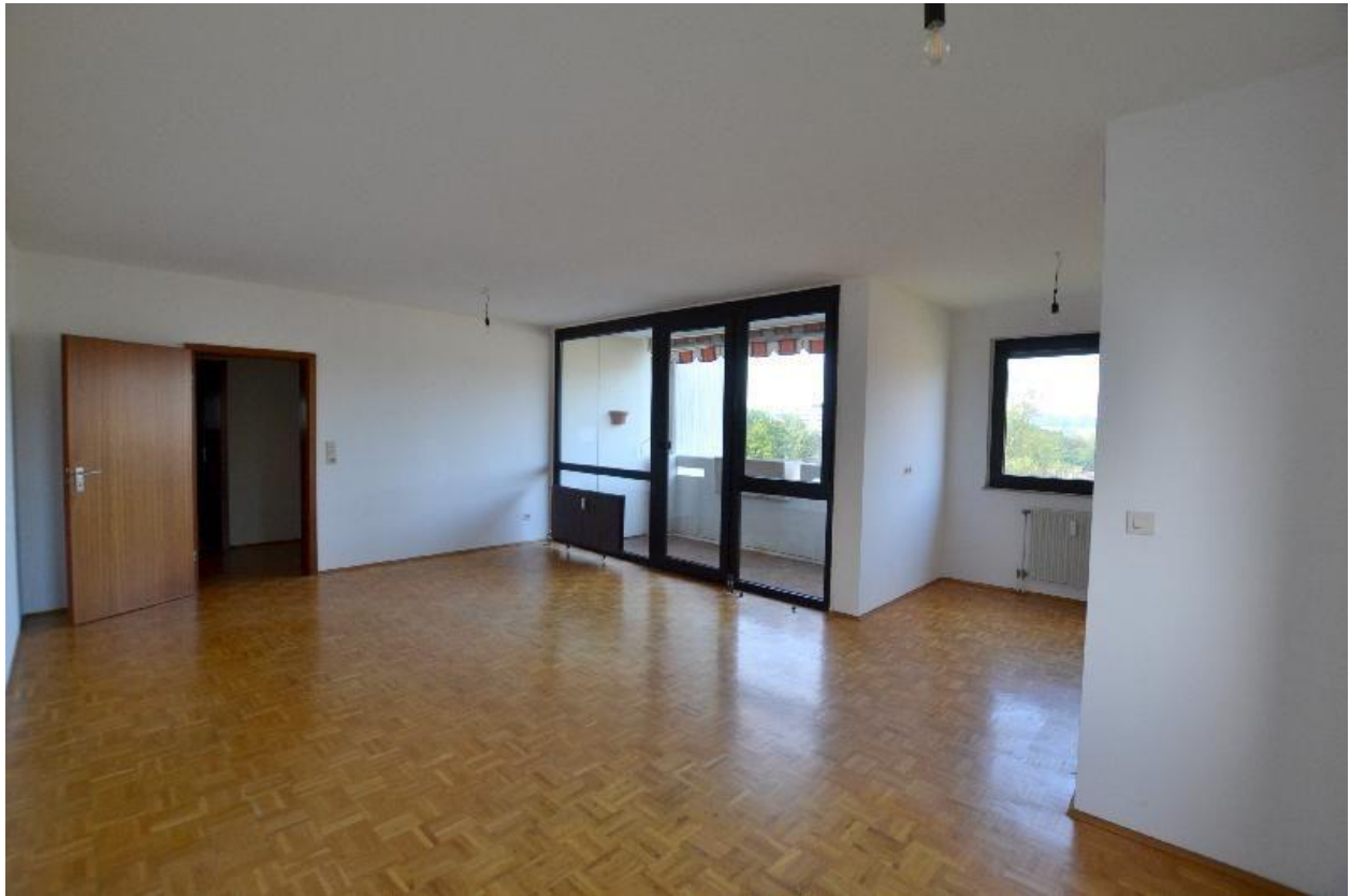
Wohnzimmer mit offener Küche