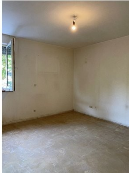
Wohnen / Schlafen