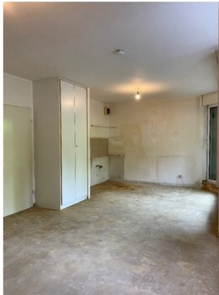
Blick zur Küche