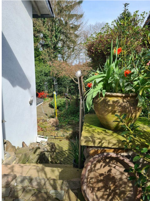
Zugang zum Garten