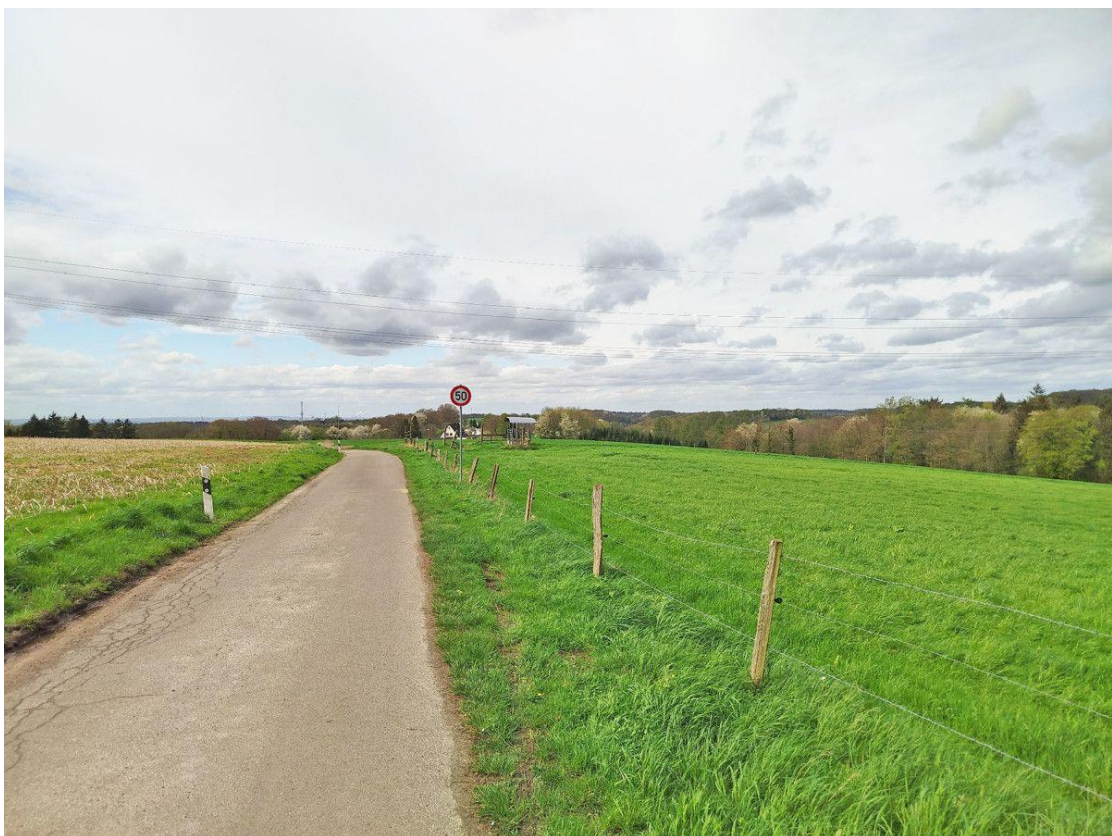
Freiheit vor der Tür