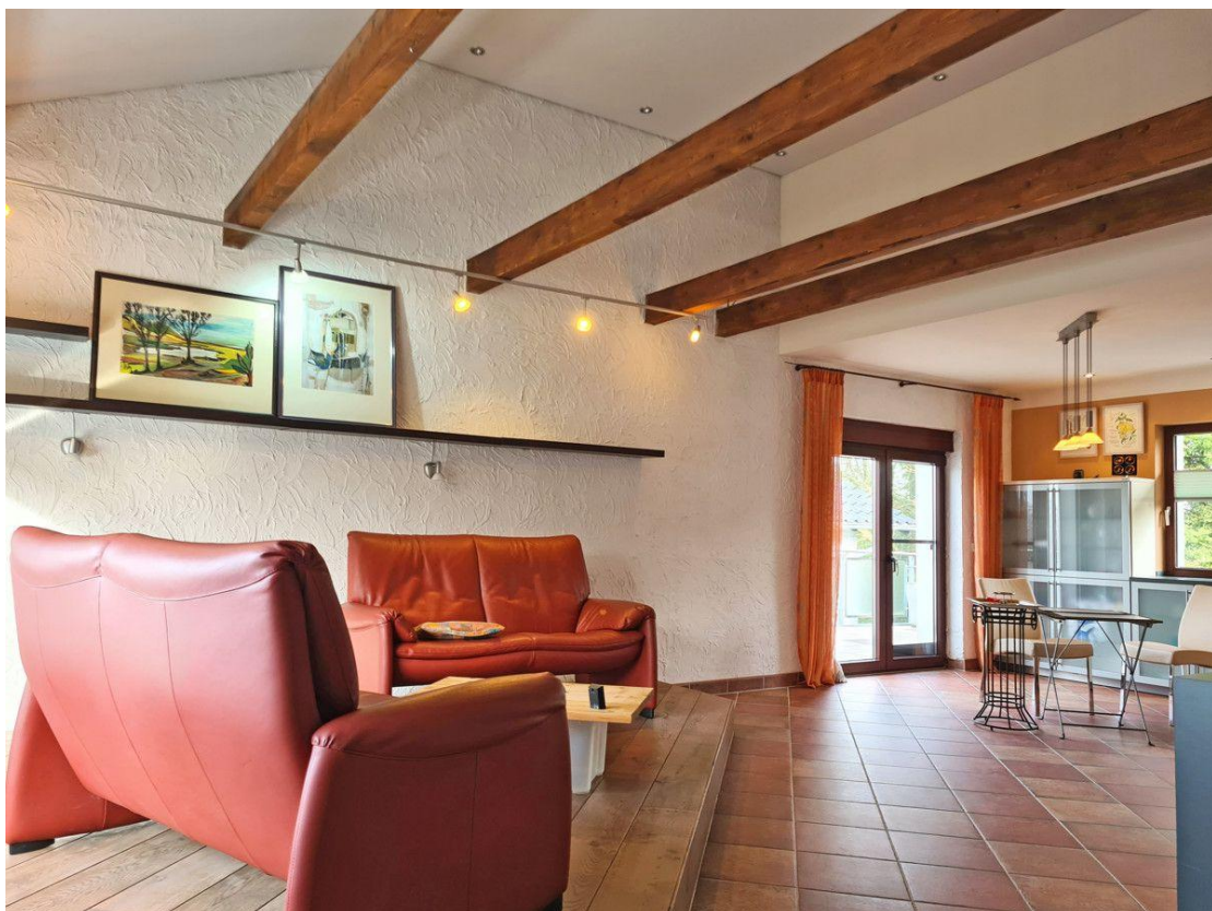
Offenes Dach und viel Licht