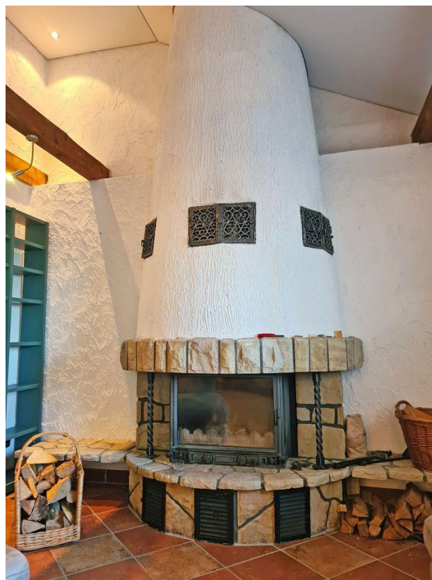
...für lauschige Stunden