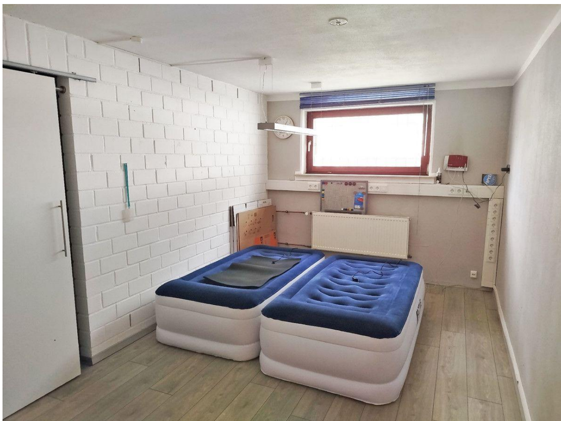
Wohnmäßig ausgebaut: Hobbyraum