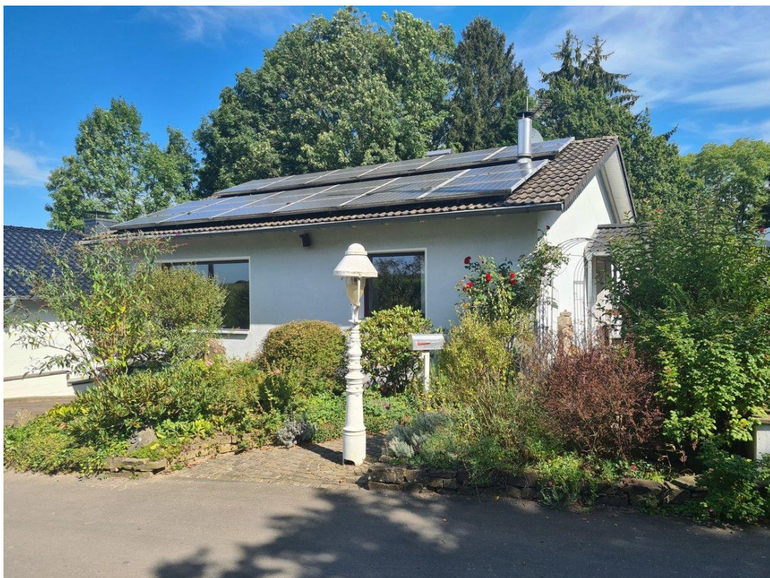
Idyllisch über Hoffnungsthal