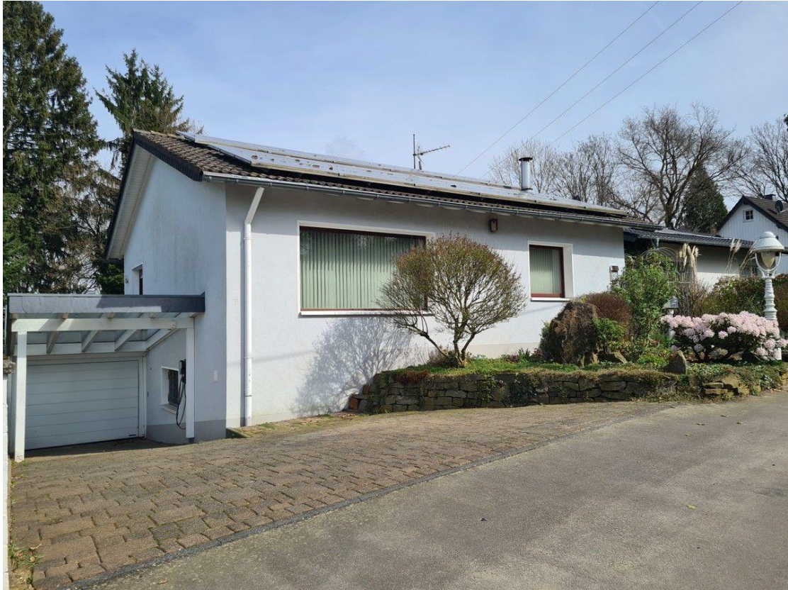
Garage und Carport mit Wallbox