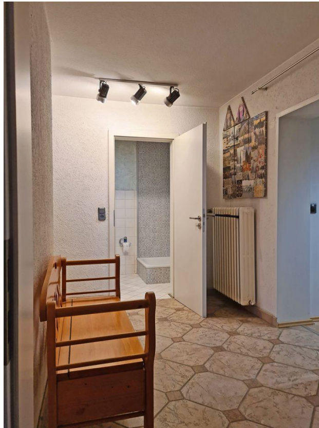
Hübsch arrangiert und...