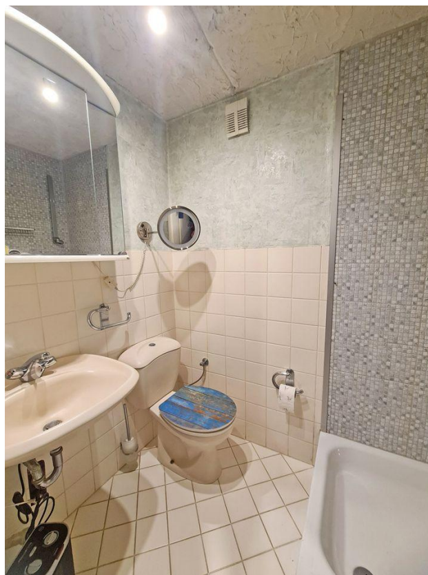
... und kleines Duschbad