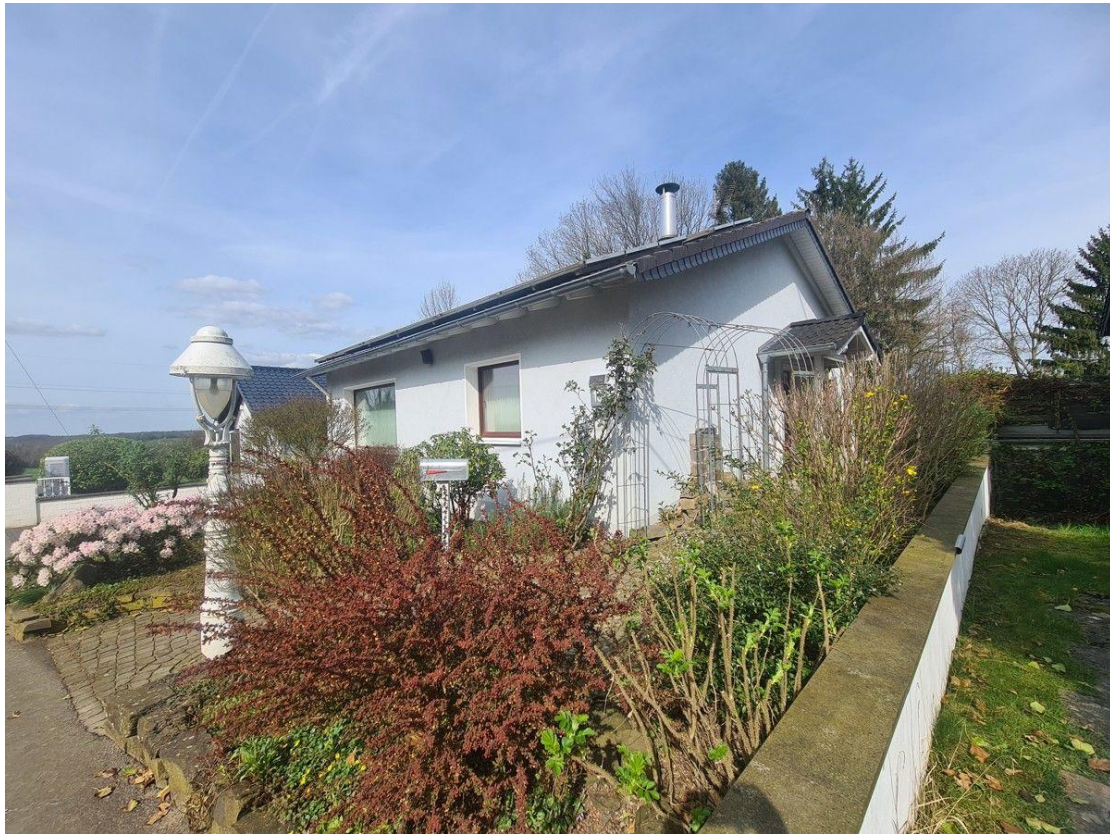
Freiraum im Herzen