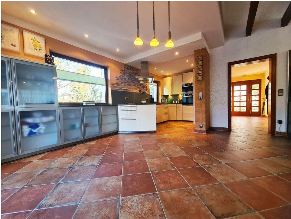
Großzügig: Offene Küche