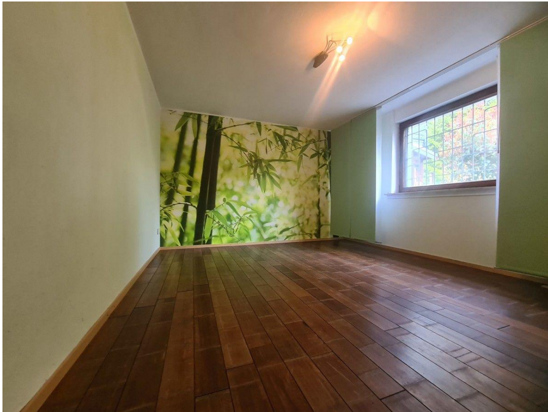
Garten - Schlafzimmer im UG...