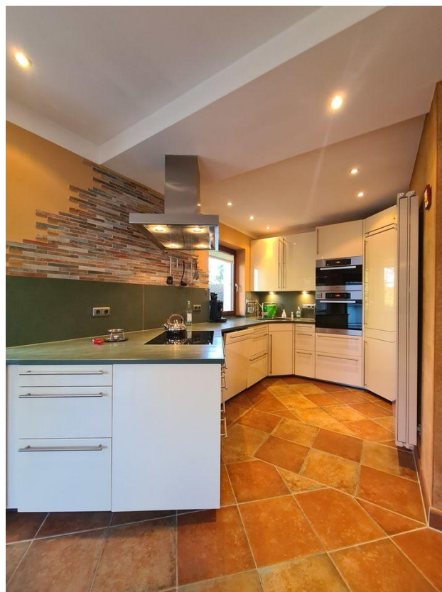
... und viel Platz...