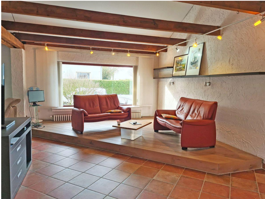
...auch im Wohnbereich!