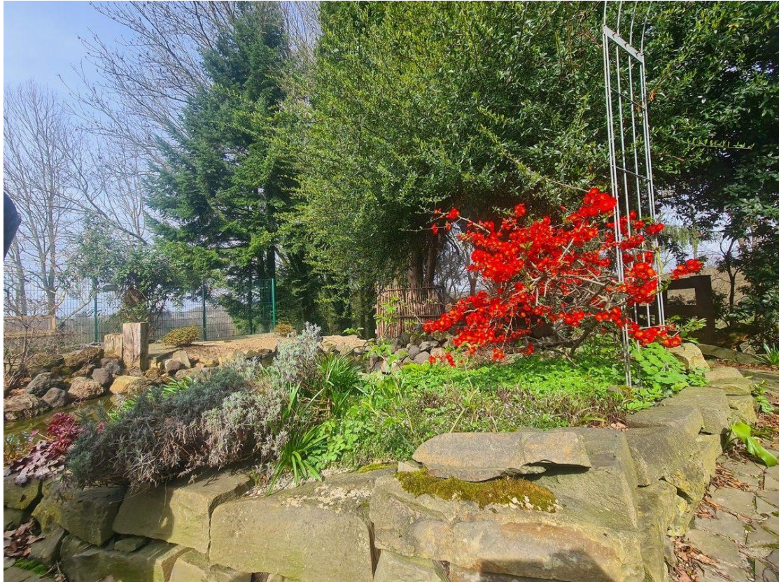
... zum Entspannen