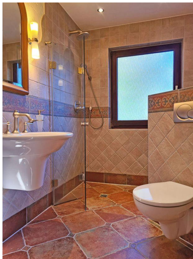
Das Bad im EG