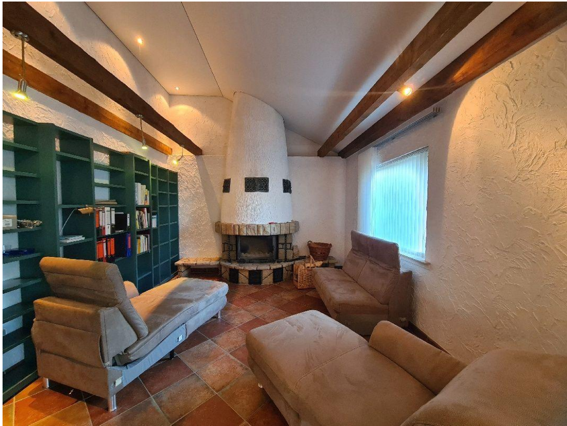
Gemütlich im Kaminzimmer...