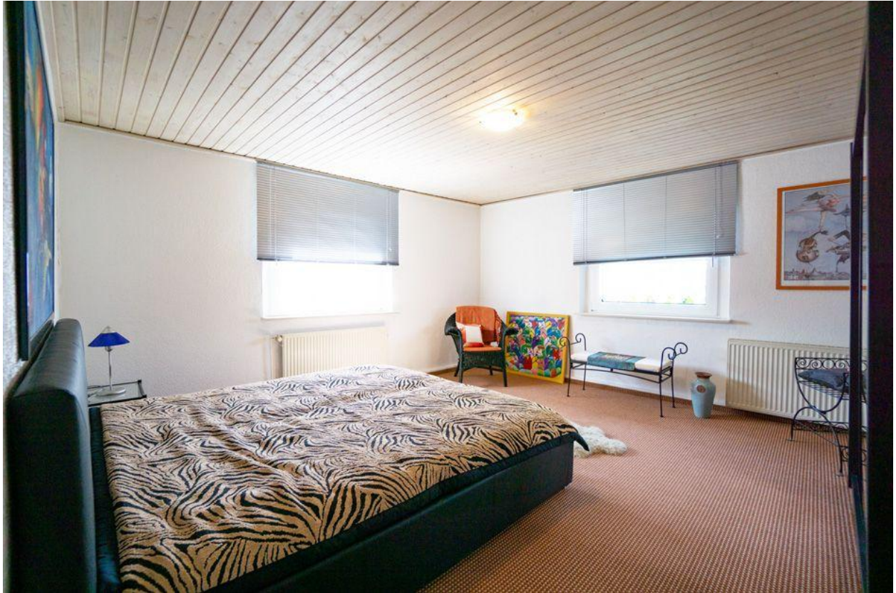
Schlafzimmer im OG