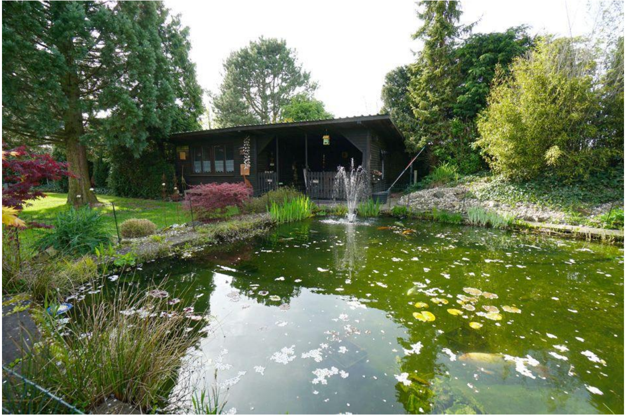
Teich mit Gartenhaus