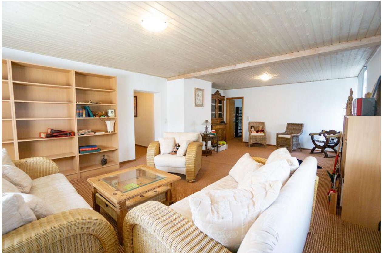
Wohnzimmer im OG