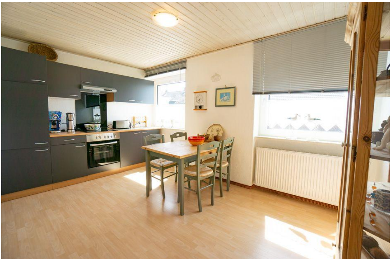
Küche im OG