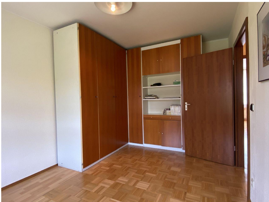
Kinder- oder Arbeitszimmer