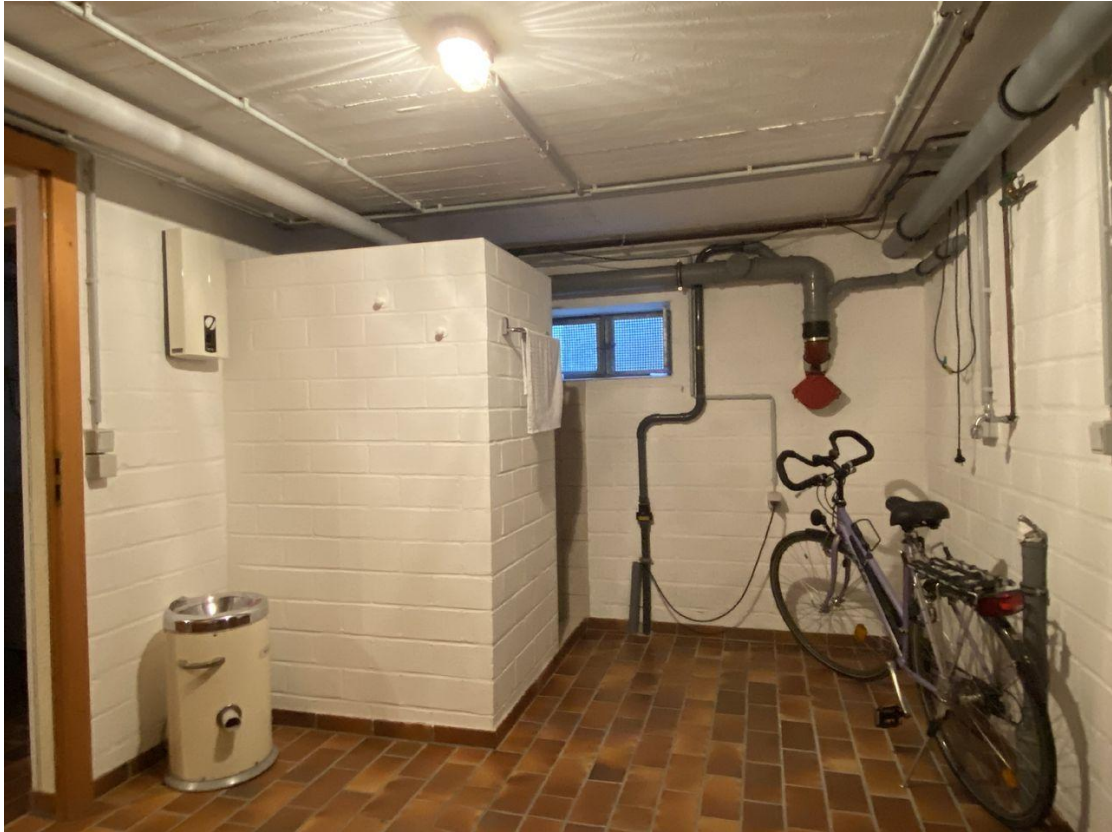
Keller mit Dusche und Außentür