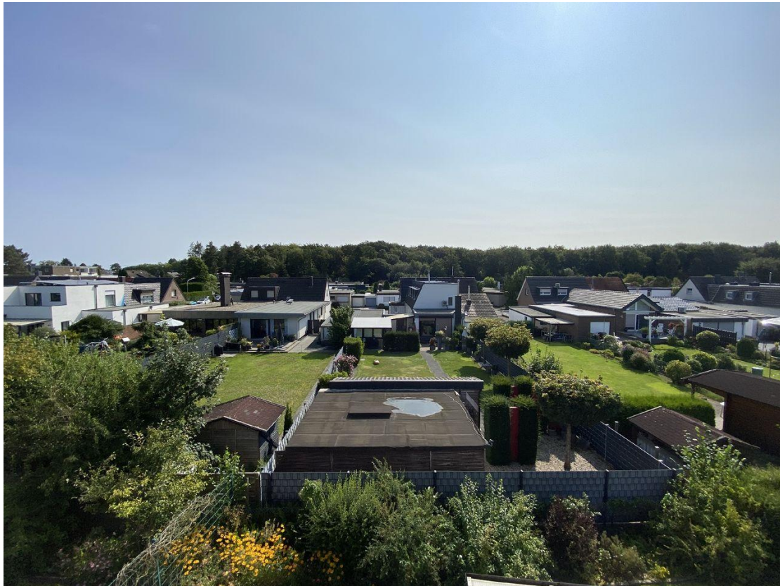
Blick aus dem Dachgeschoss (Richtung Hardter Wald)