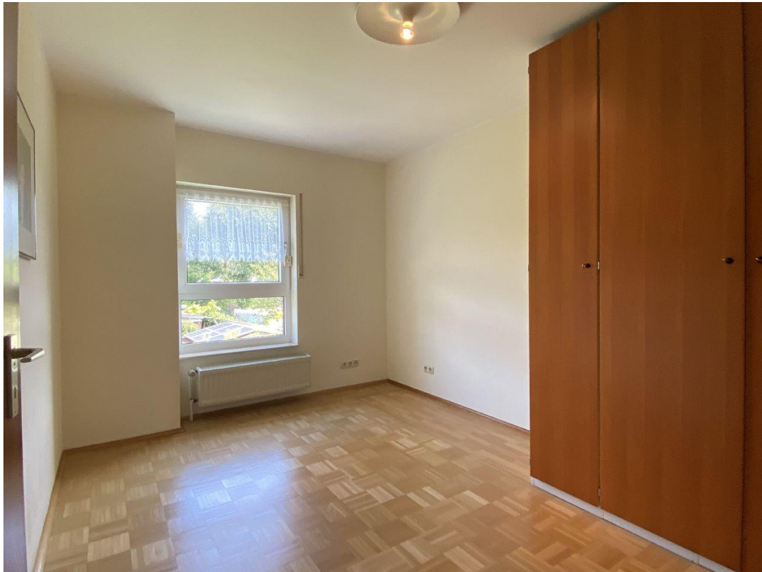
Kinder- oder Arbeitszimmer