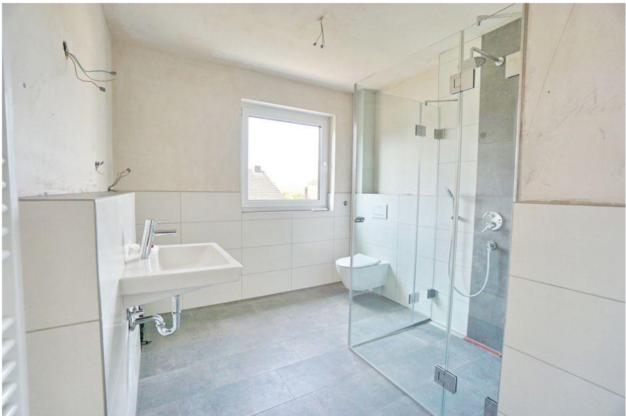
Bad mit begehbare Dusche