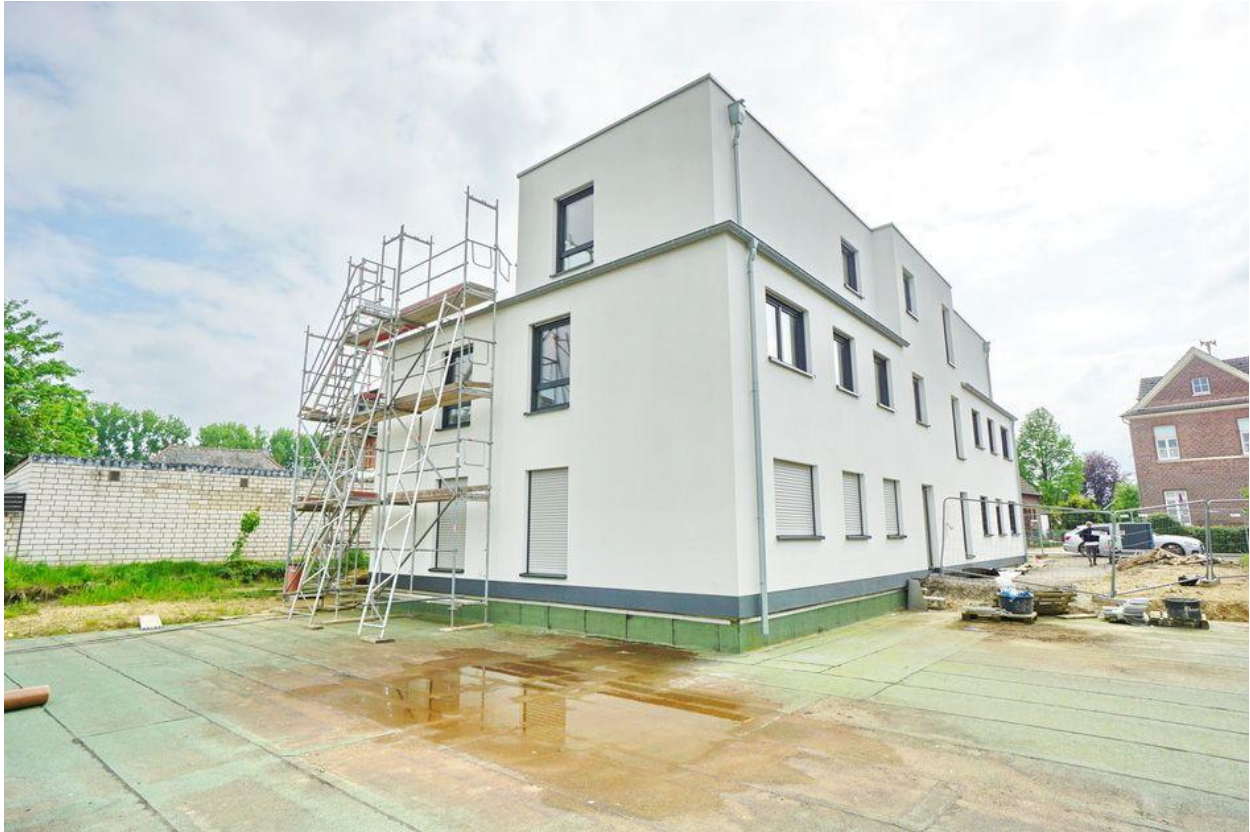
Alpen-Menzelen: Eigentumswohnung im Neubau