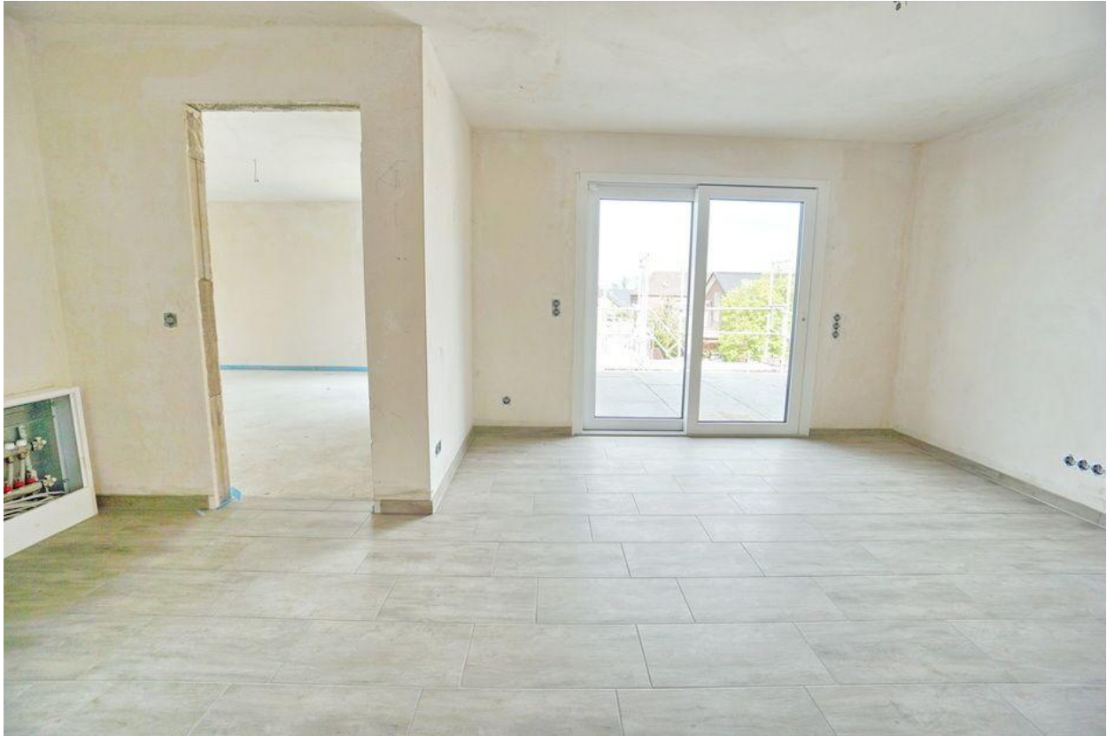
... mit Zugang zur Dachterrasse