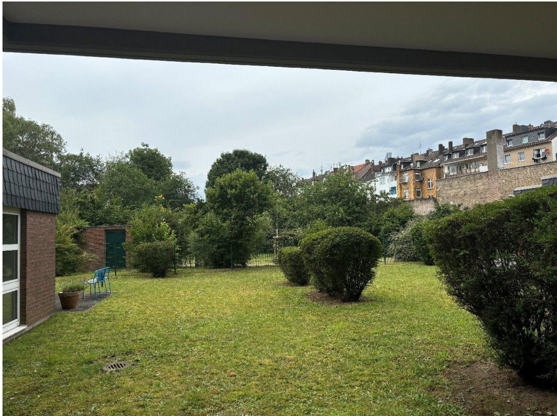
Ausblick zum Innenhof