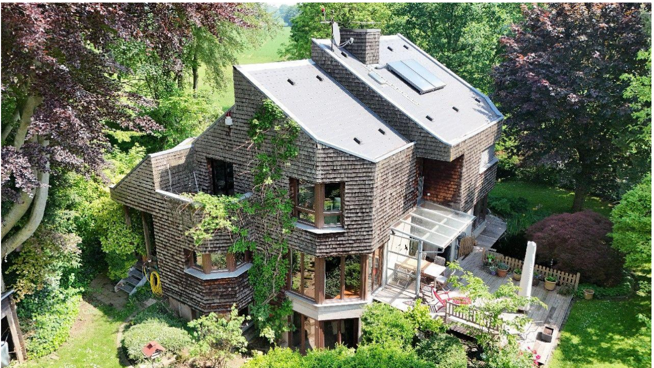
Die Lage zählt!