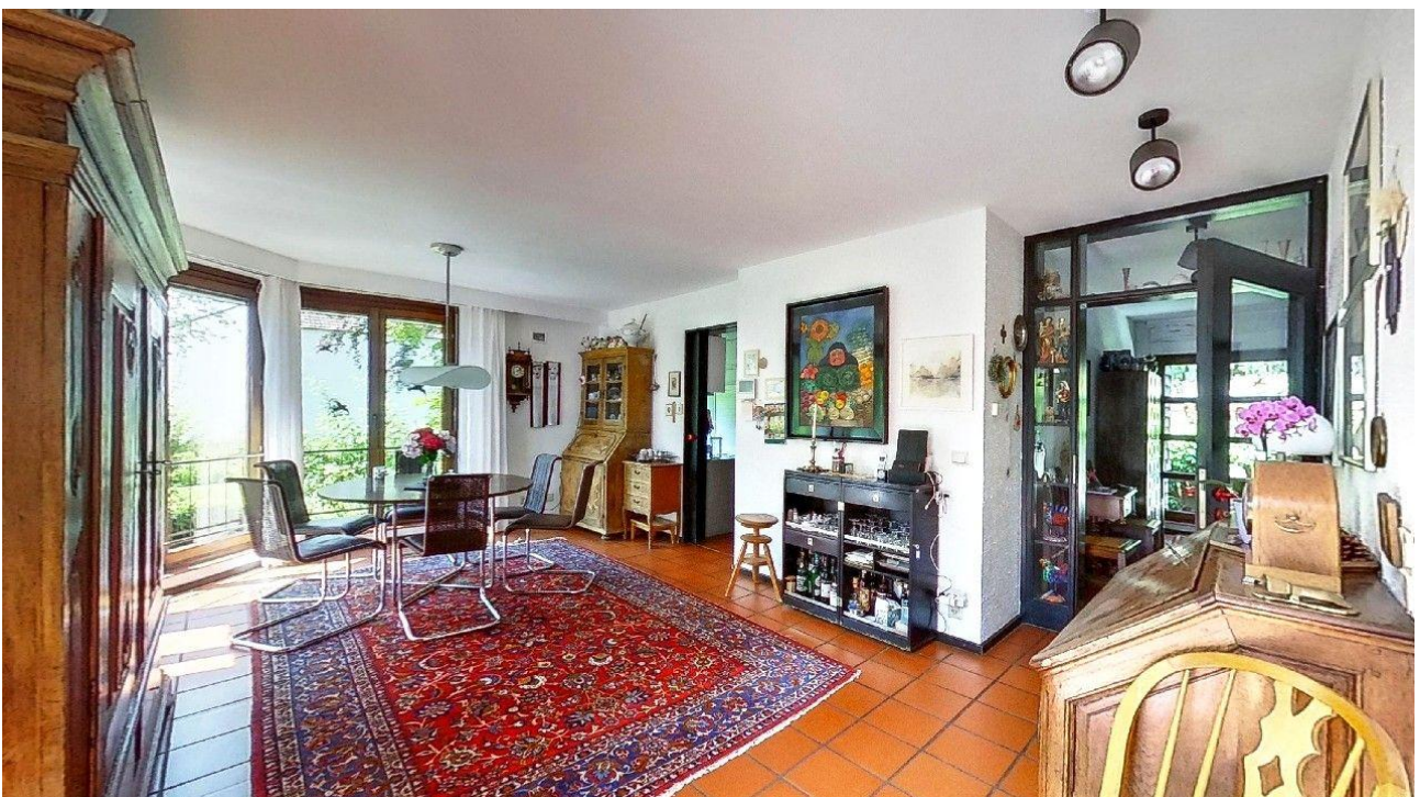
Blick zum Essplatz