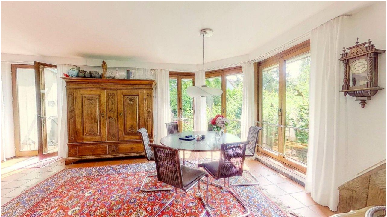
Blick von der Küche