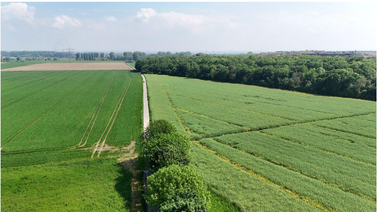
an den Rheinauen in Dormagen