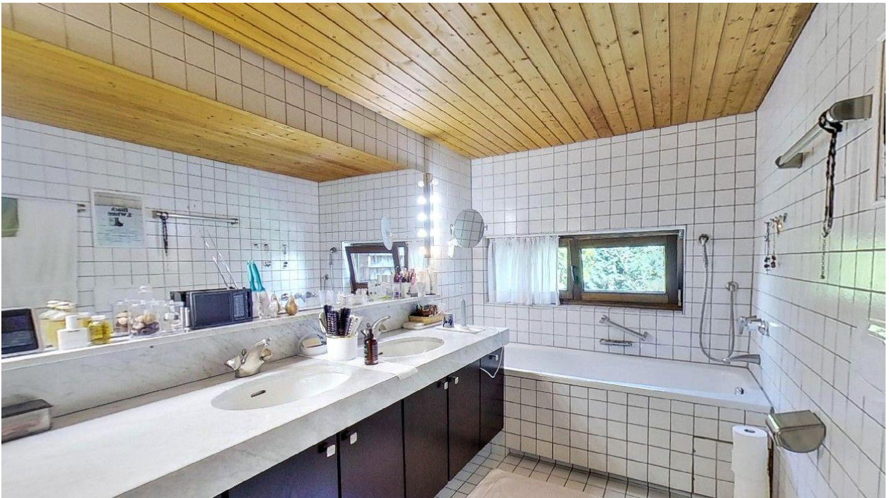
Elternbad im OG