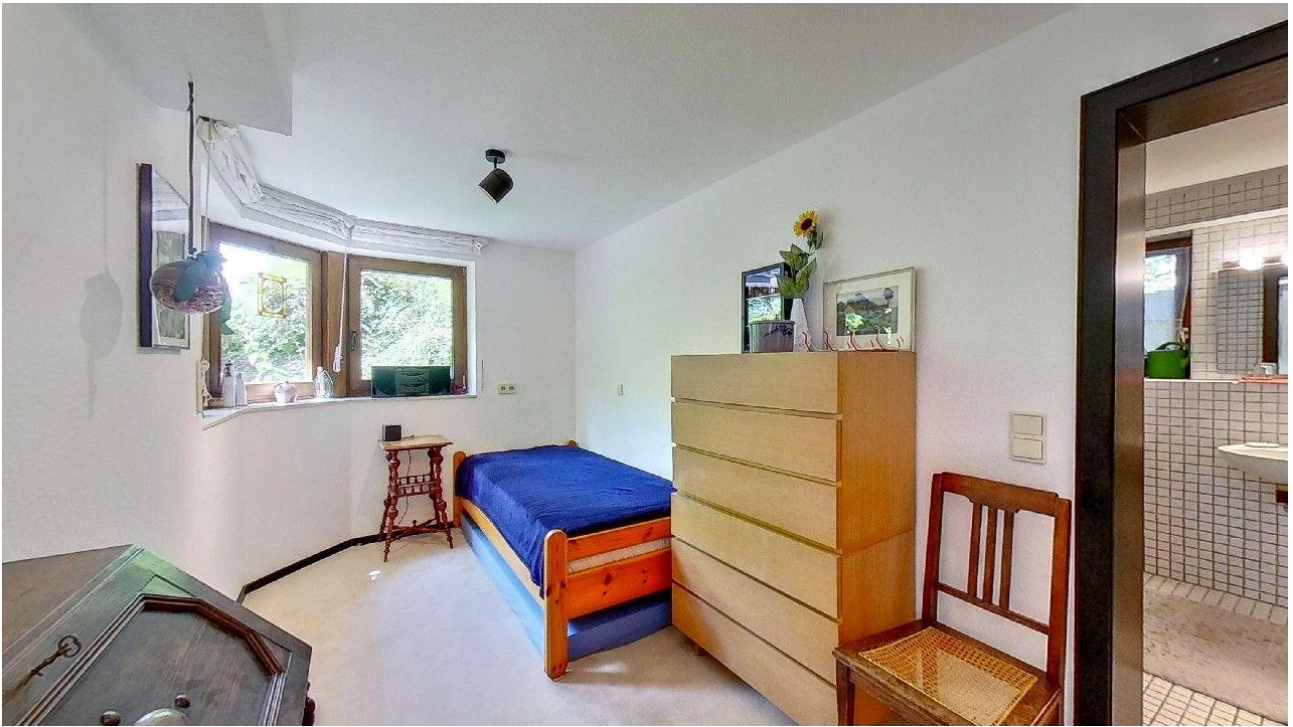
Zimmer im UG