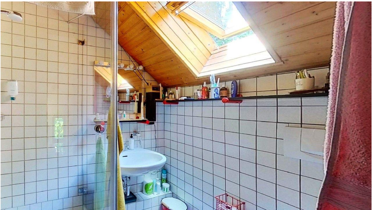
Duschbad im OG