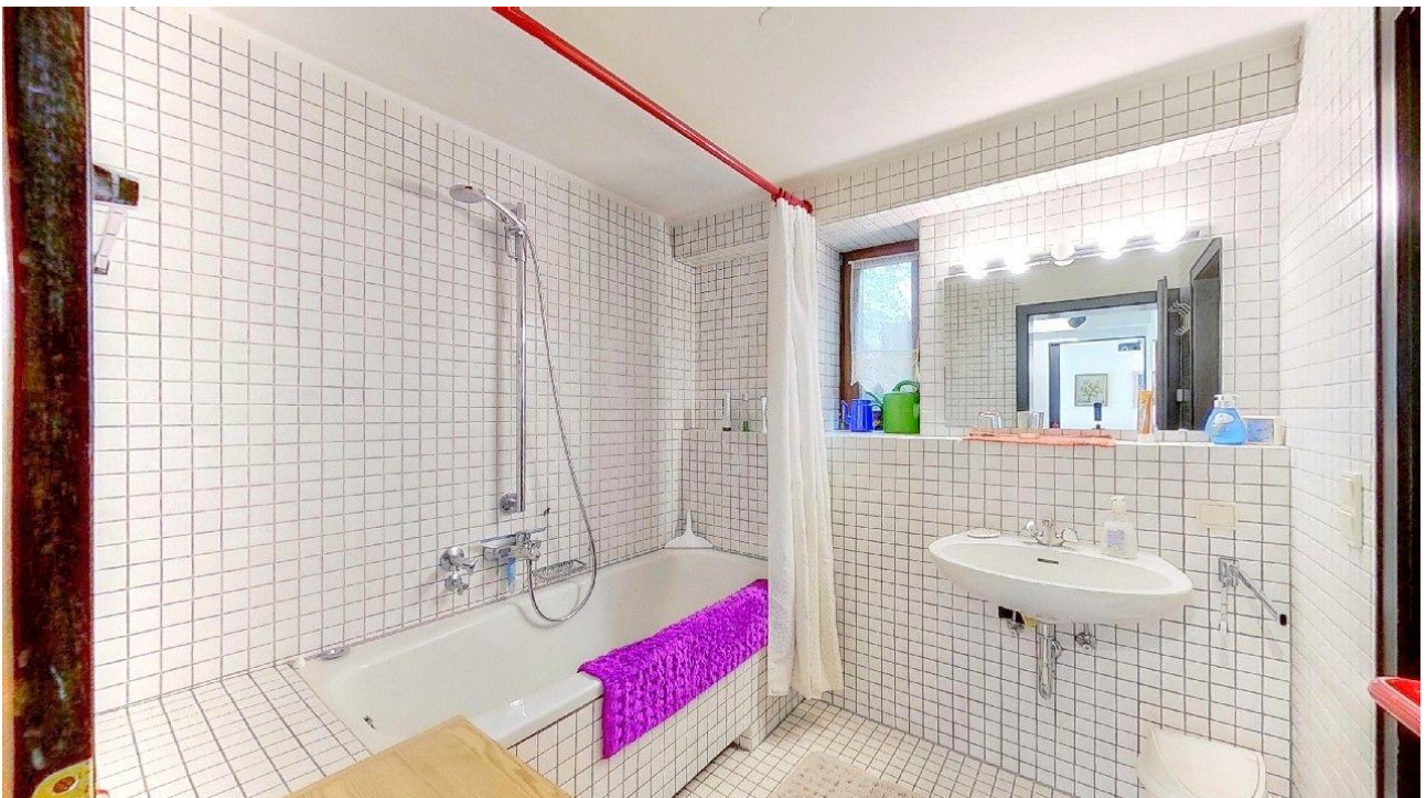
Badezimmer im UG