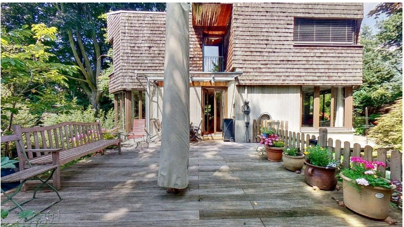
Terrasse in Westlage