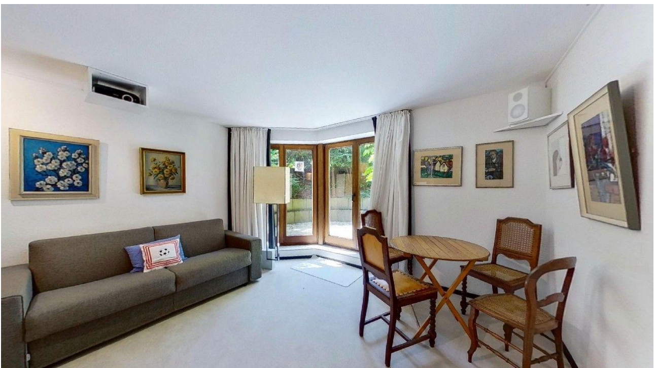
Wohnzimmer im UG