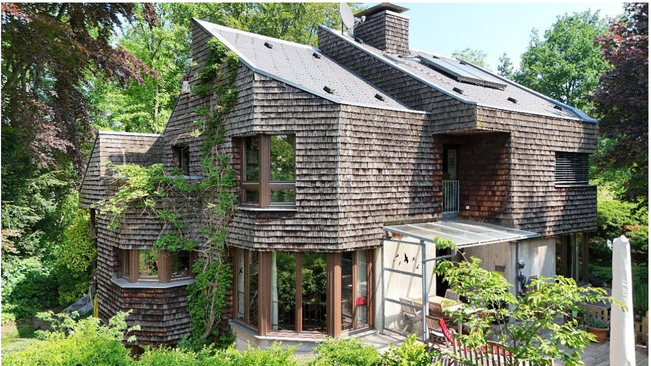
mit nachhaltiger Fassade