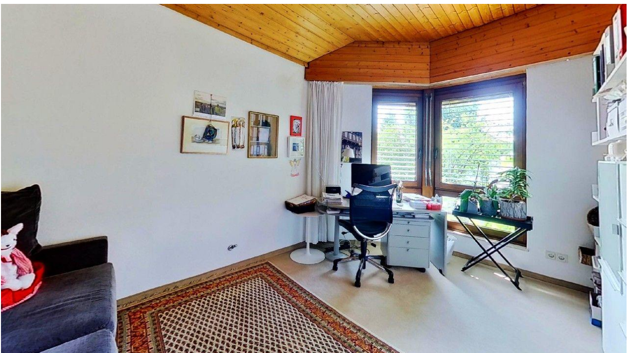
weiteres Zimmer OG