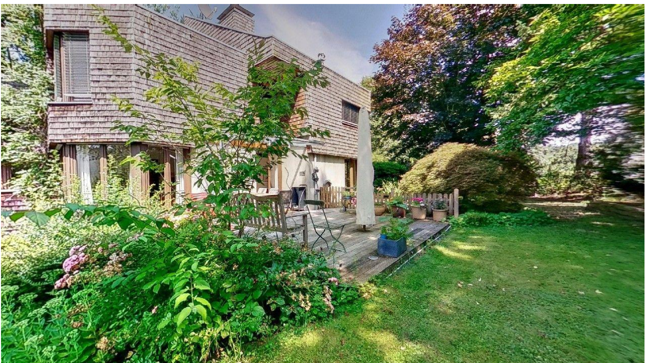
über 1000m 2 Grundstück