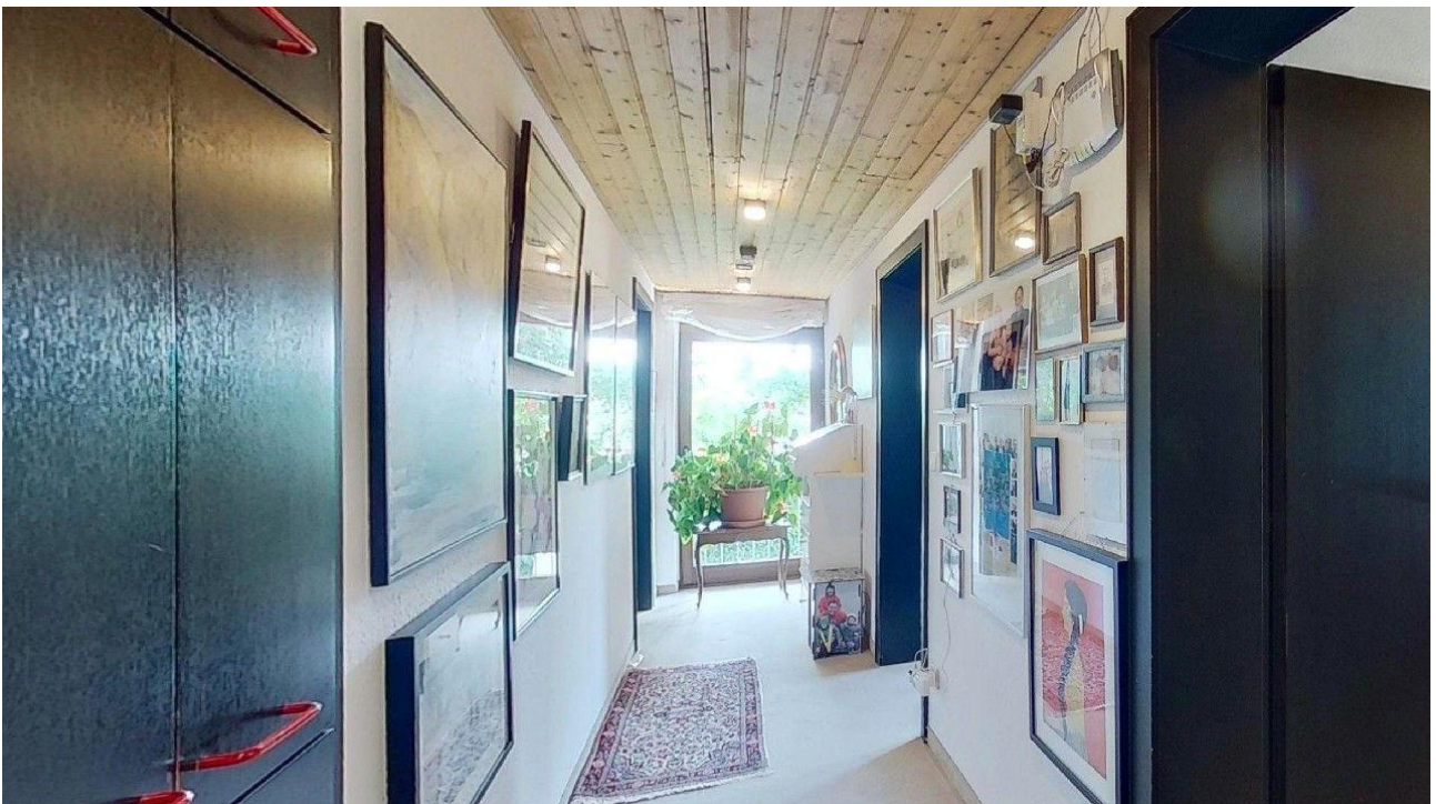
Flur im OG