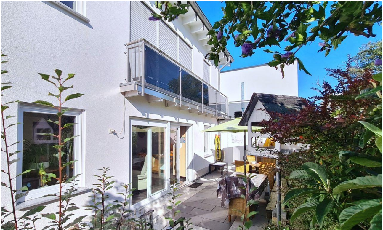
Rückansicht / Terrasse