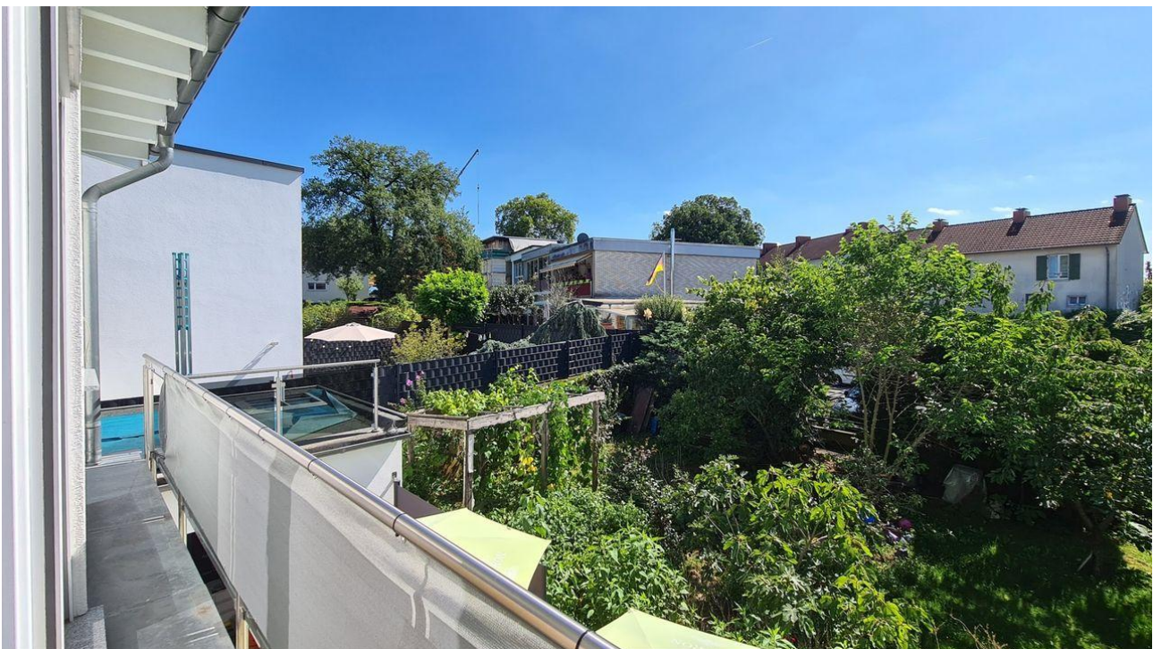
Blick vom Balkon vor dem Schlafzimmer OG