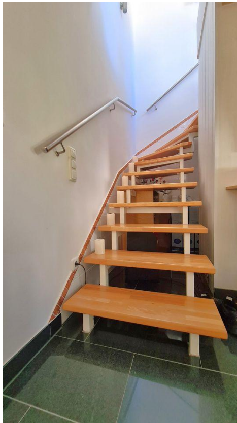
Treppe ins OG