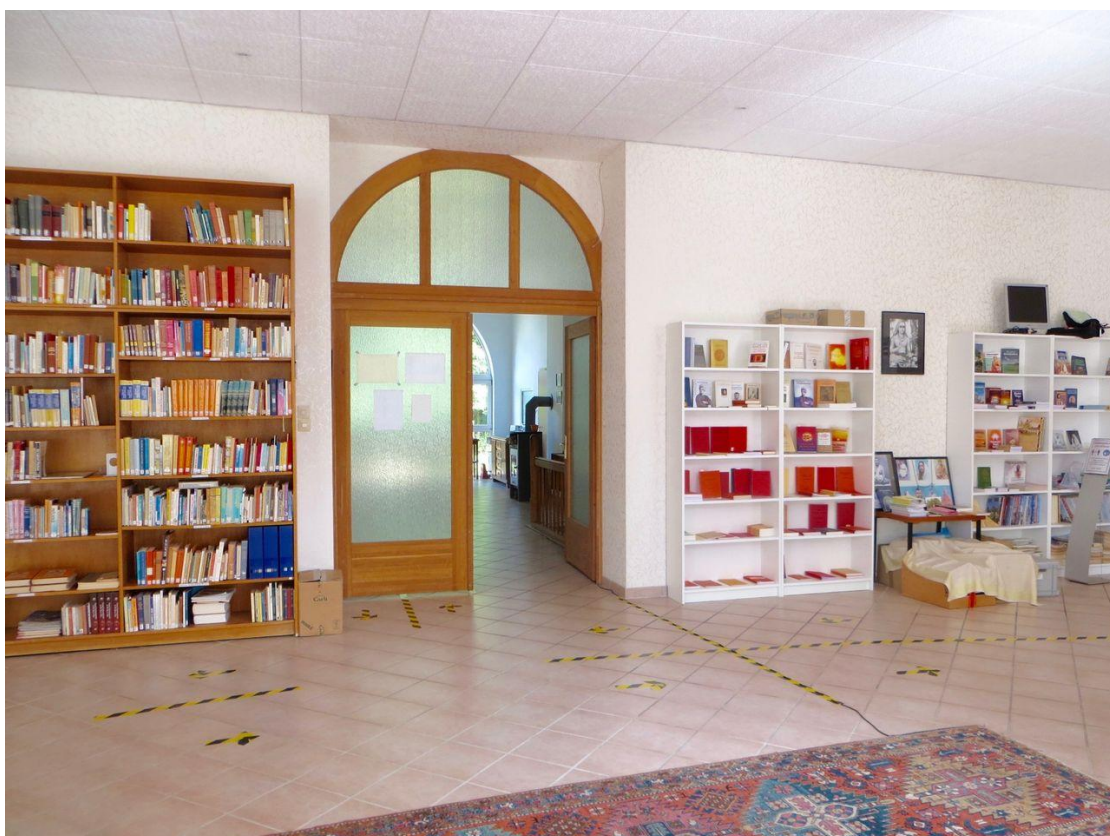
Vortragsraum mit Bibliothek