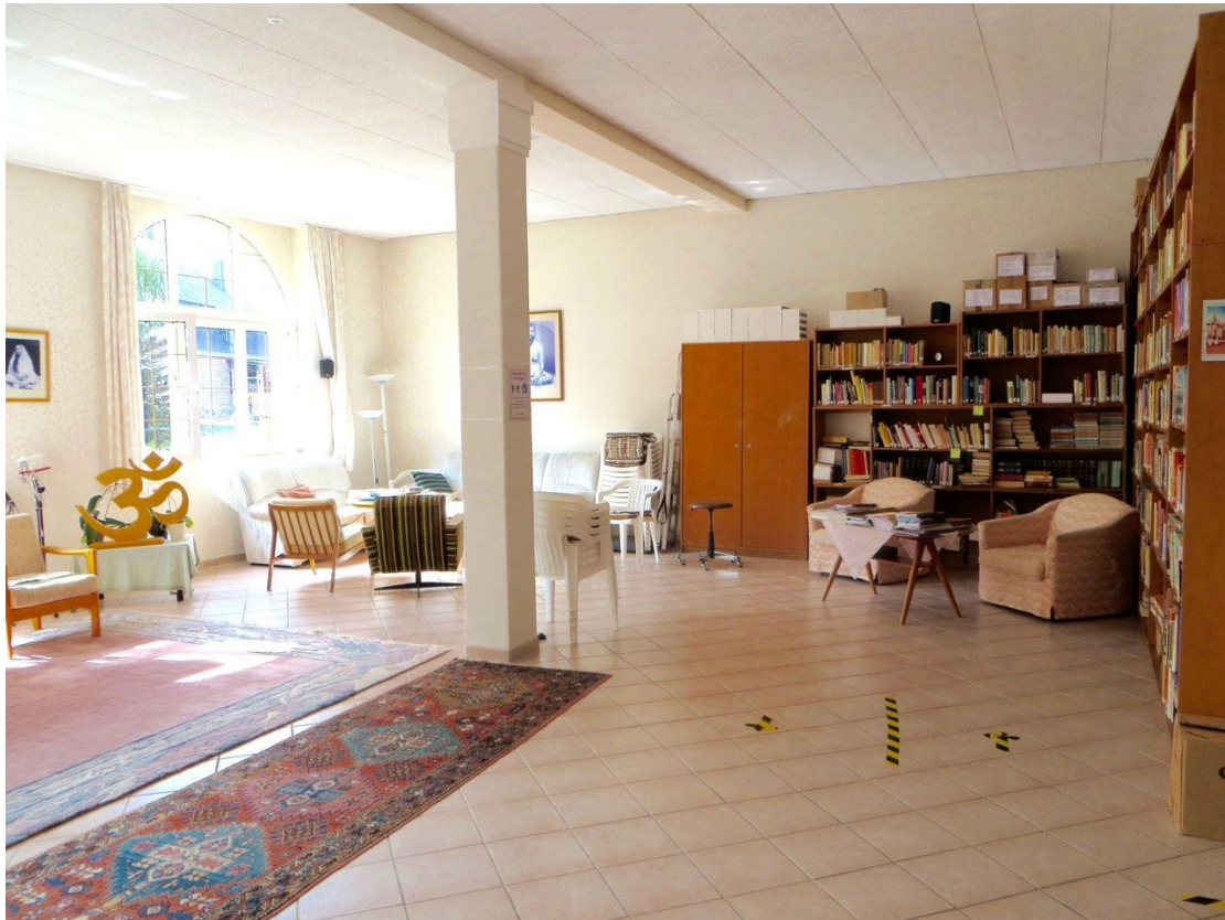
Vortragsraum mit Bibliothek