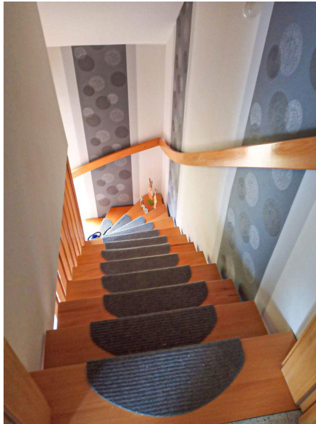
Holztreppe nach oben