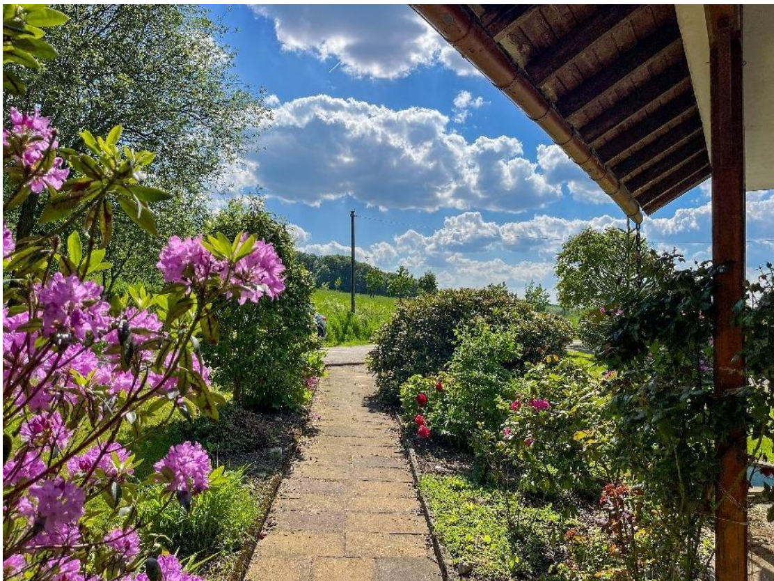
Weg zum Haus