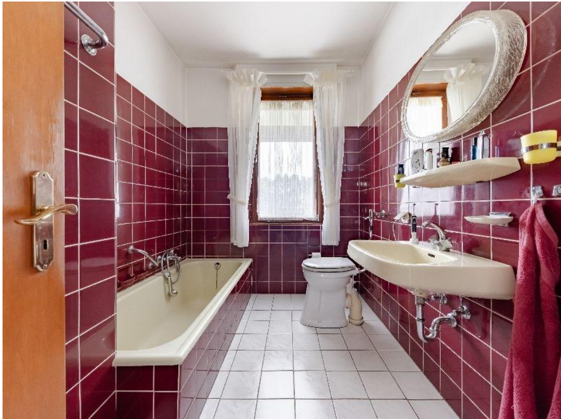
Tageslichtbad mit Wanne