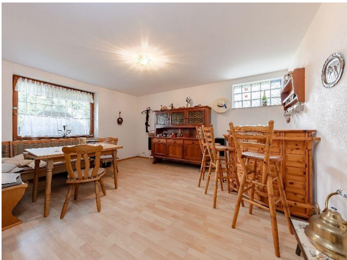
KG: ausgebautes Zimmer