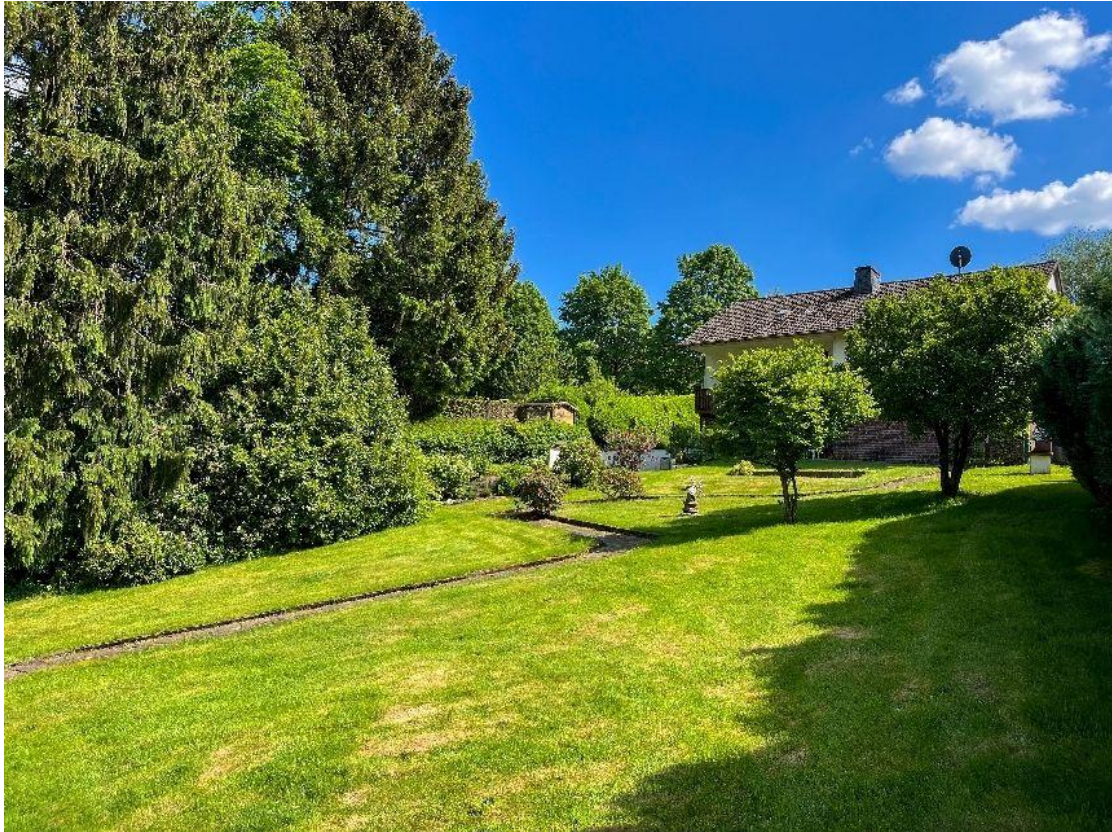
top gepflegter Garten