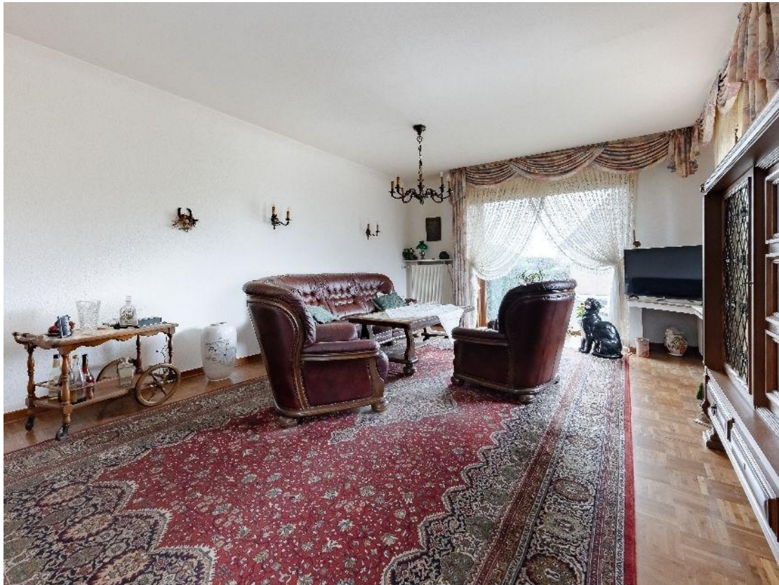
helles Wohnen mit Balkon