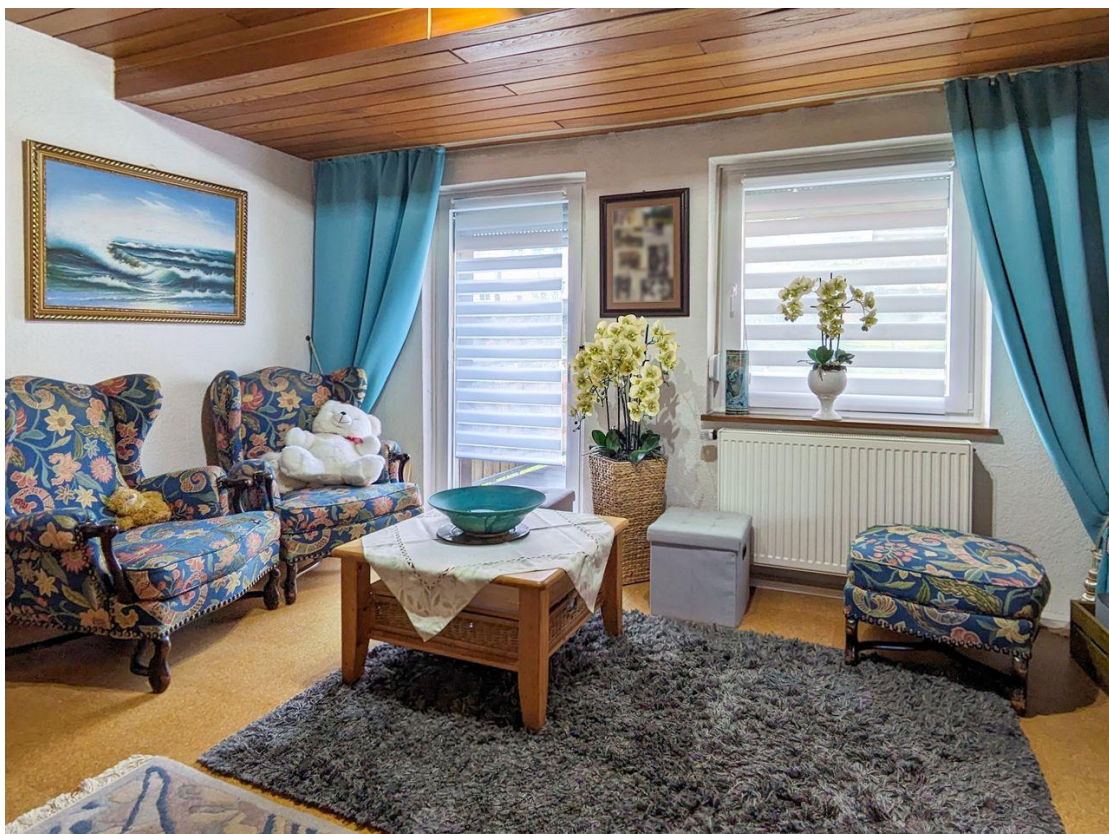
Wohnbereich mit Zugang zum Balkon