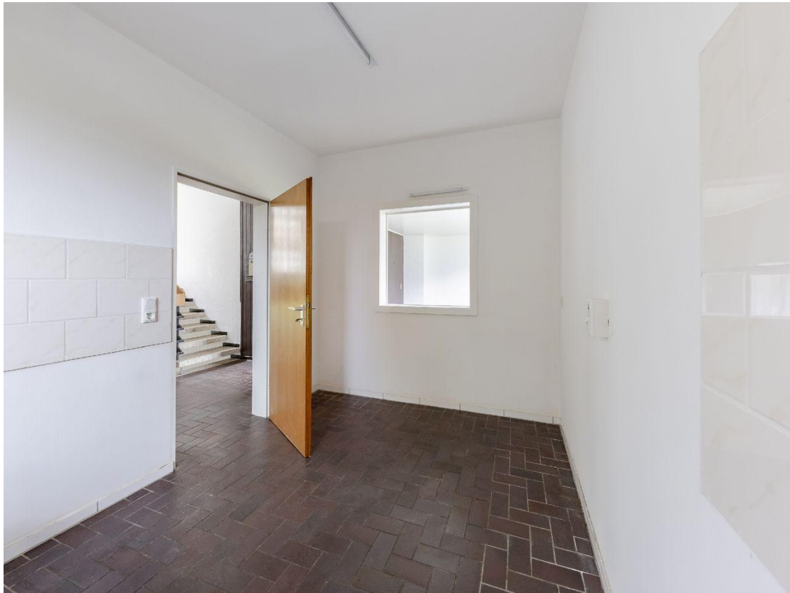
Küche - Istzustand