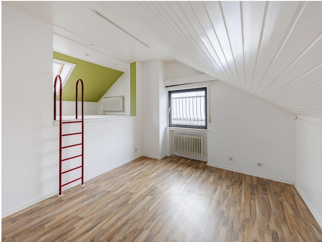
Kinderzimmer mit Luftraum im Dachgeschoss