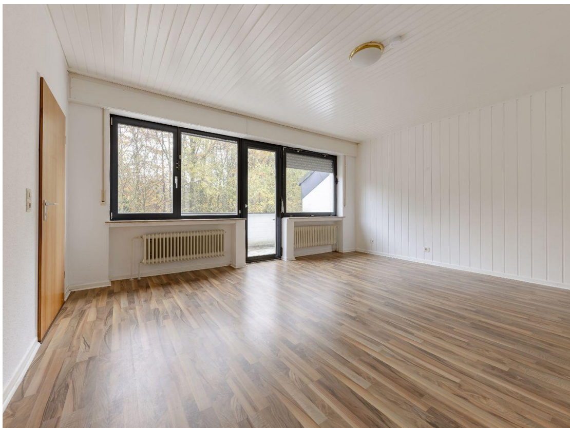
Schlafzimmer OG mit Balkon