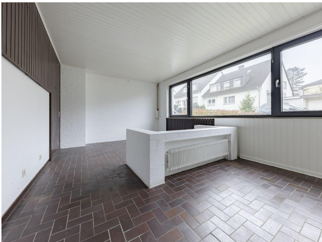
Wohnzimmer - Istzustand