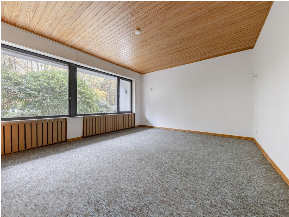
Schlafzimmer - Istzustand