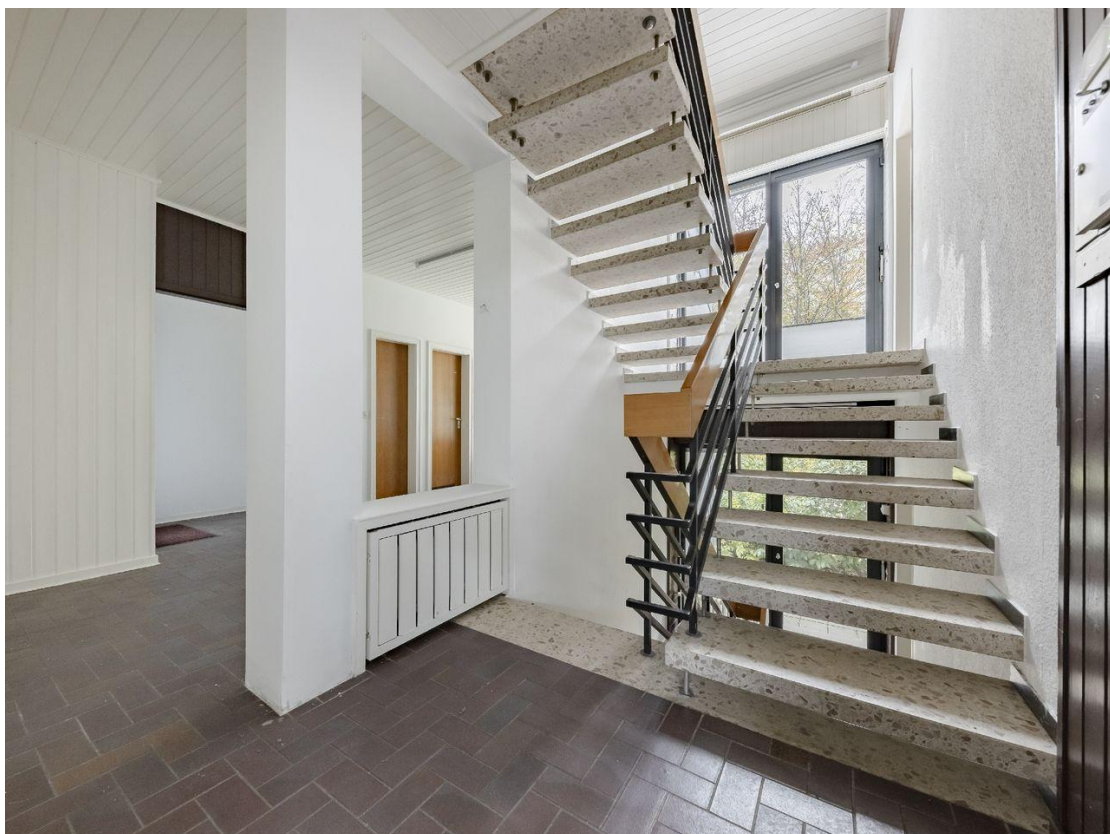
Treppenhaus - Istzustand