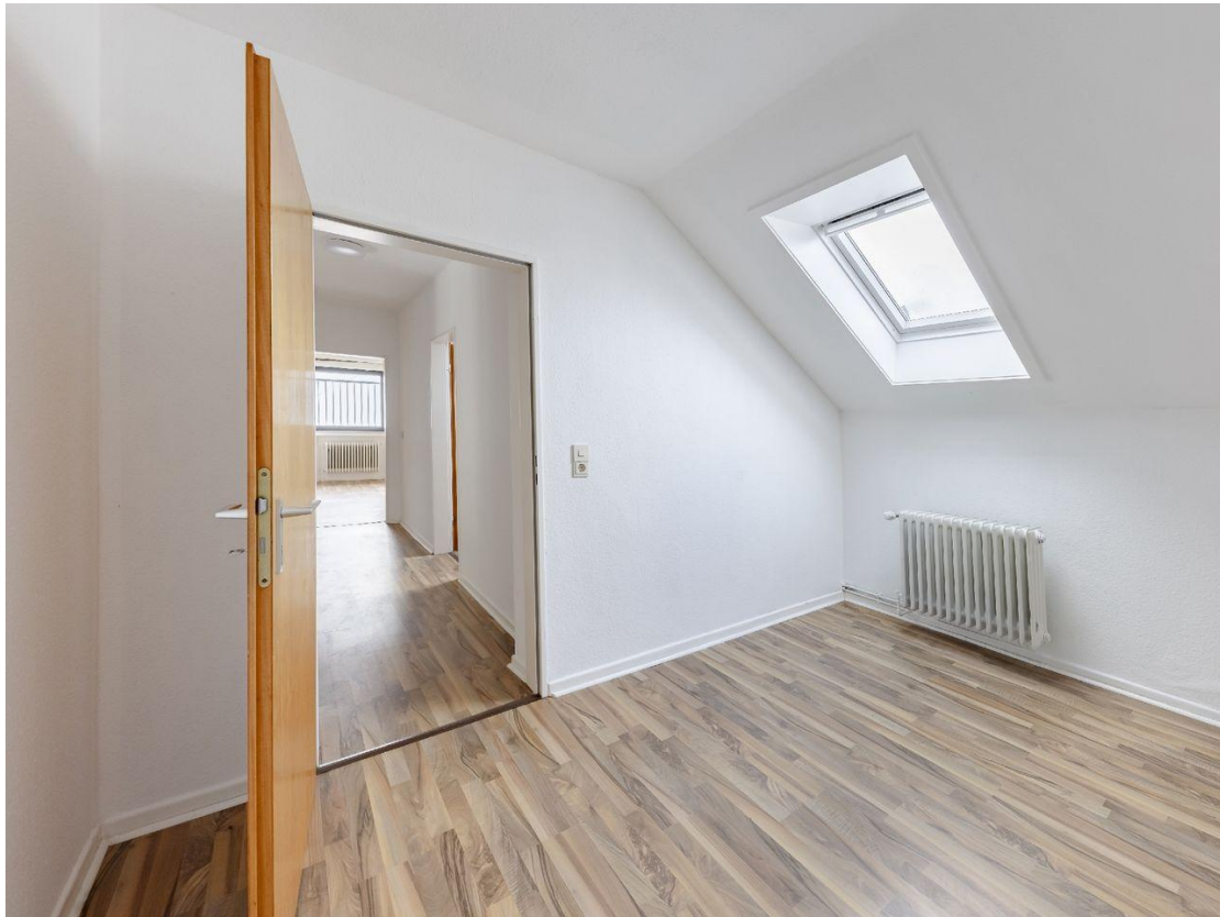
wohlich ausgebautes Zimmer im Dachgeschoss