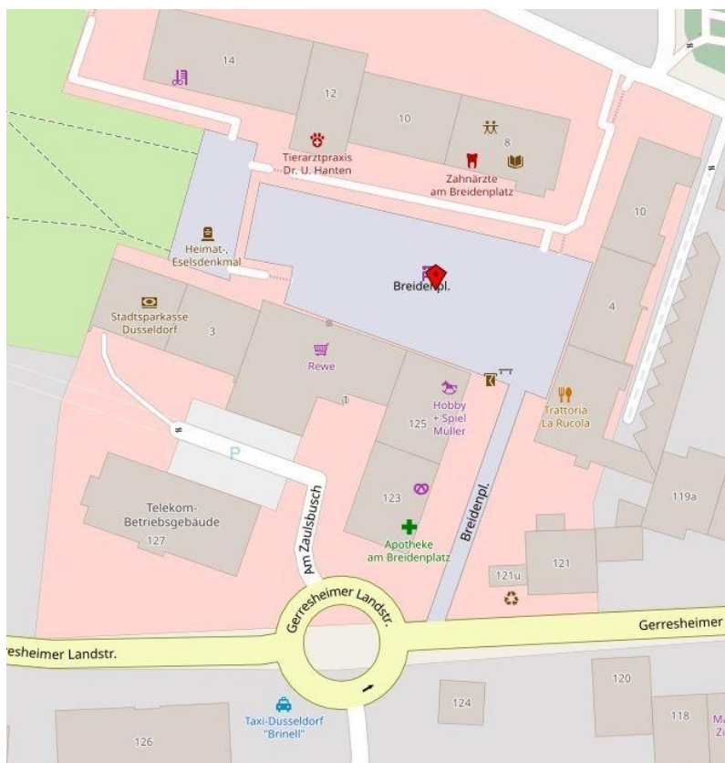
Neue Mitte Unterbach