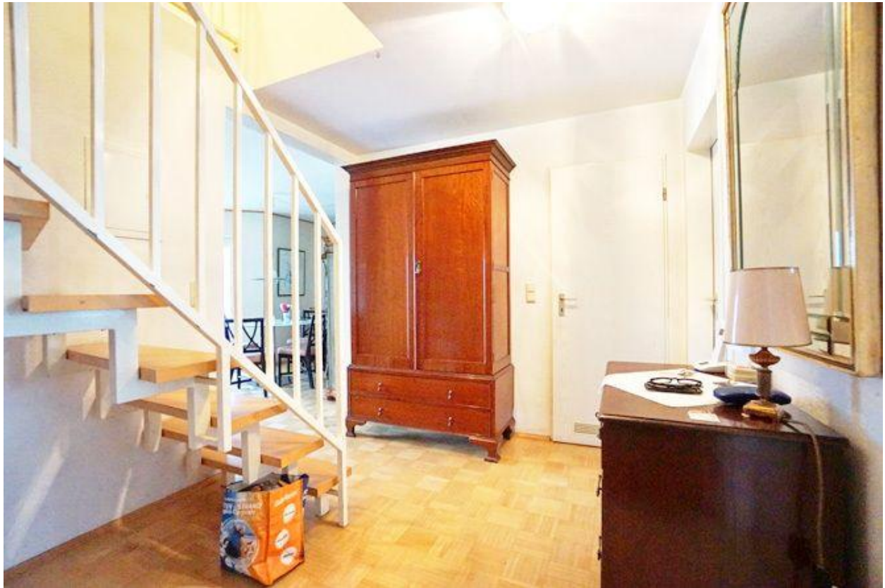
Rheinberg-Budberg: ETW im DG