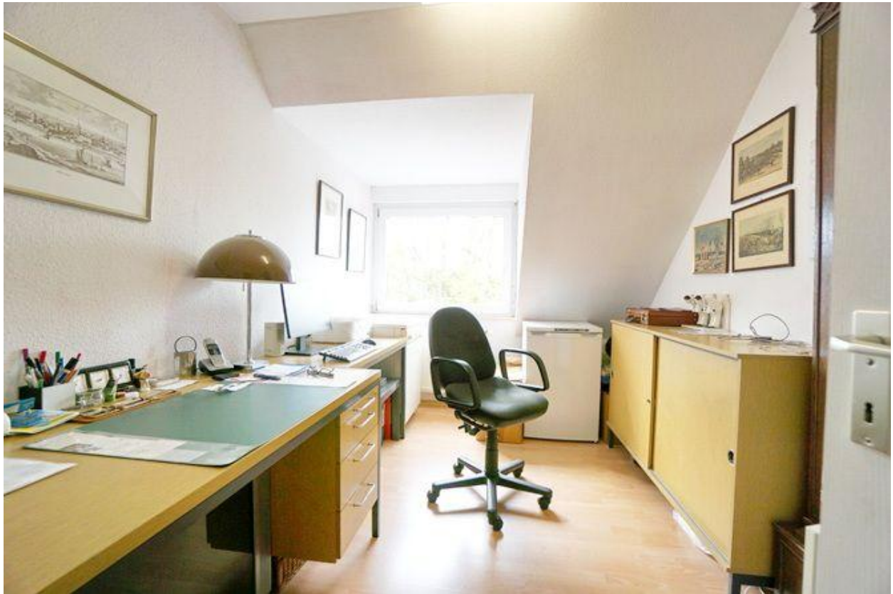
Büro- oder Gästezimmer