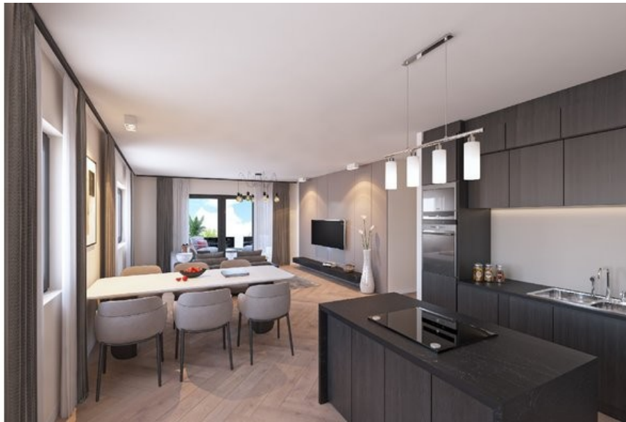
Impression Wohnen Kochen