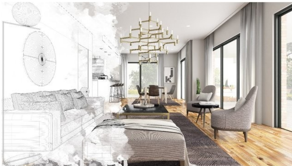
Gestaltung nach Ihren Wünschen