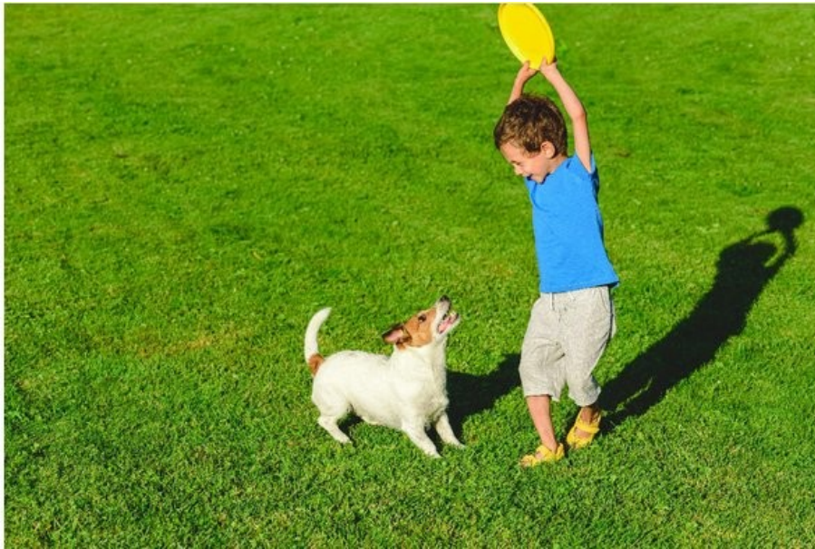
Spielen im eigenen Garten