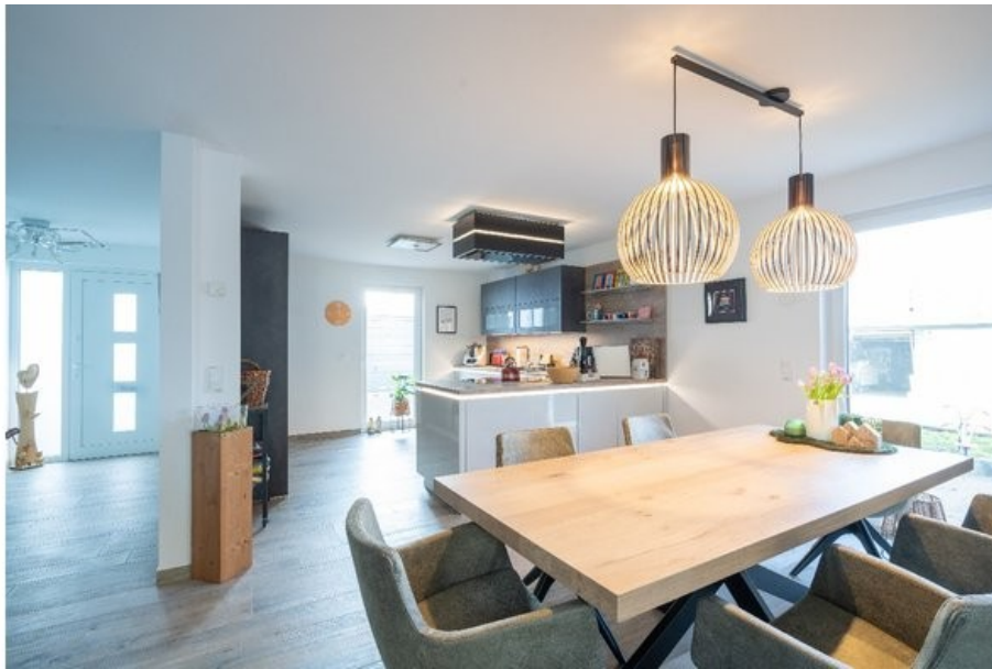
Beispiel offener Wohn-/Essbereich