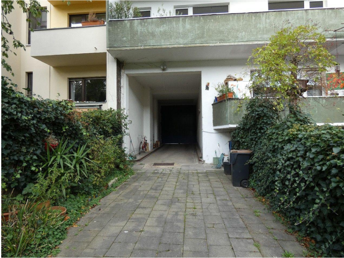
Toreinfahrt / Hof