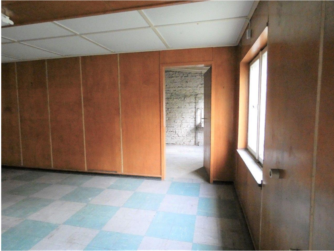
Durchgang Lagerraum 3