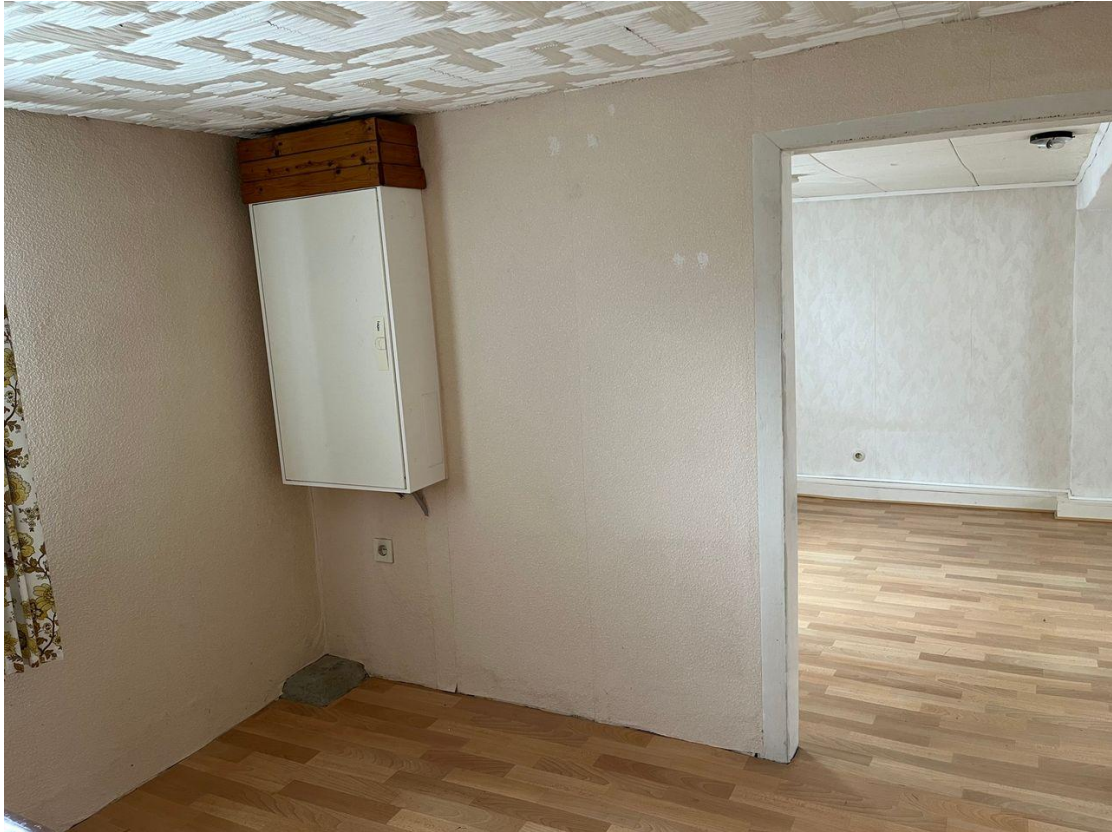
Flur - Obergeschoss