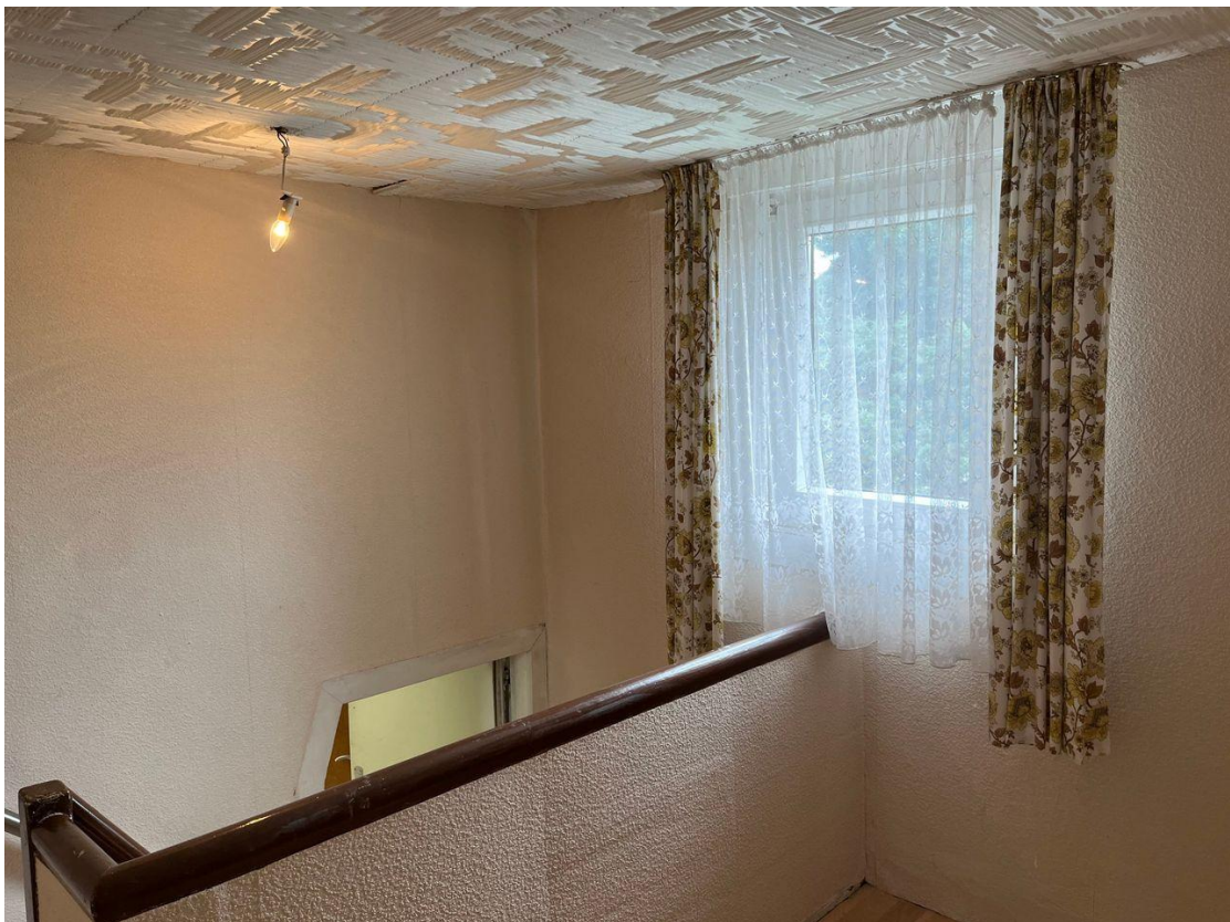
Flur - Obergeschoss