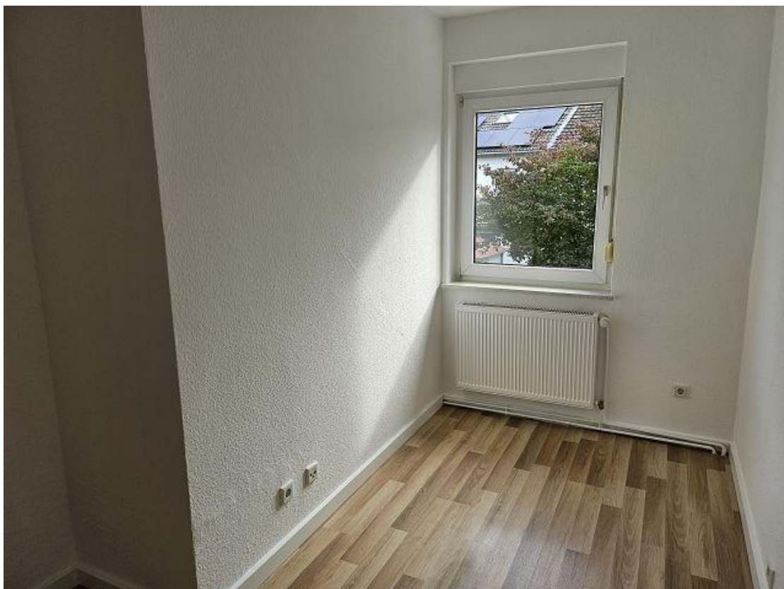
Kind / Arbeitszimmer