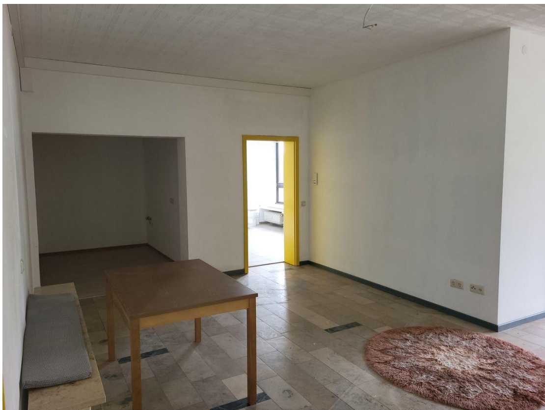
Wohn-/Essbereich mit Küche