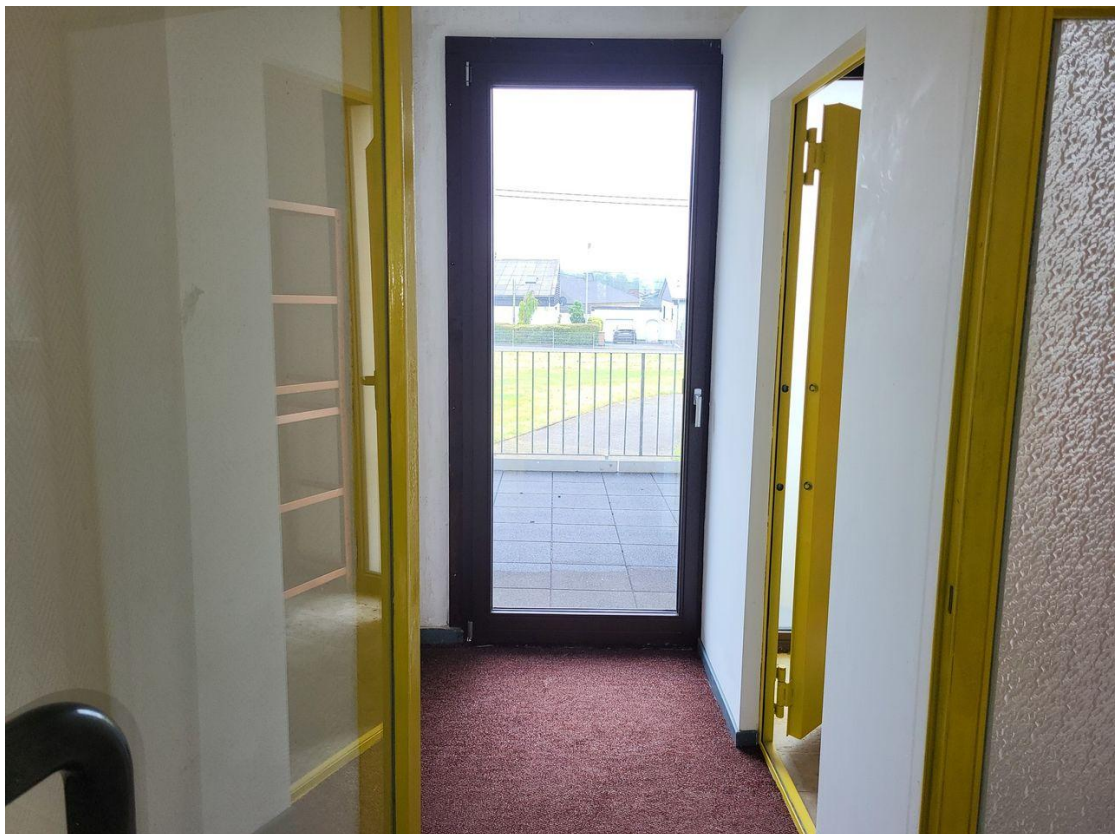
Zugang zum Balkon