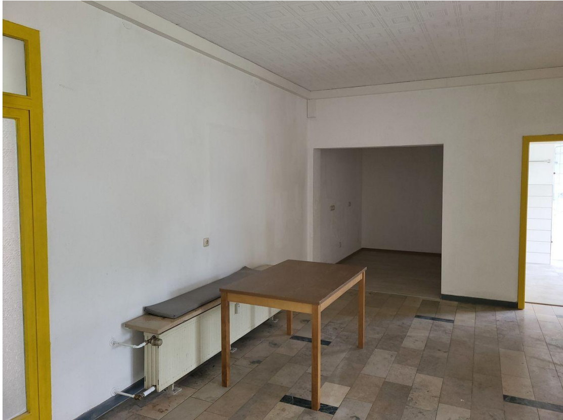
Essbereich mit Küche