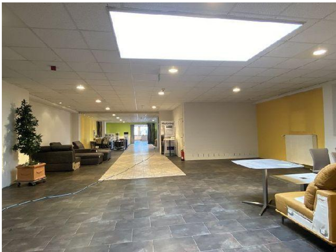
flexible Fläche (Ausstellung/ Personal/ Büro/ Lager)