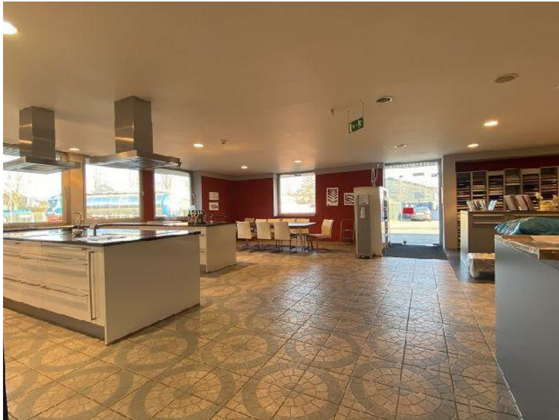
flexible Fläche (Ausstellung/ Personal/ Büro/ Lager)