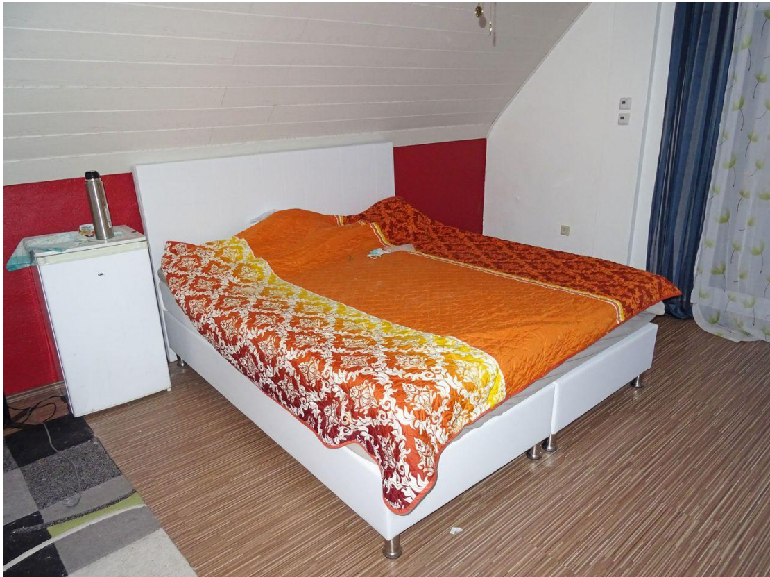
Schlafen DG mit Zugang zum Balkon 2