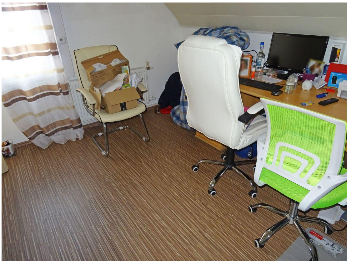
Büro mit Zugang zum Balkon 2 rückseitig