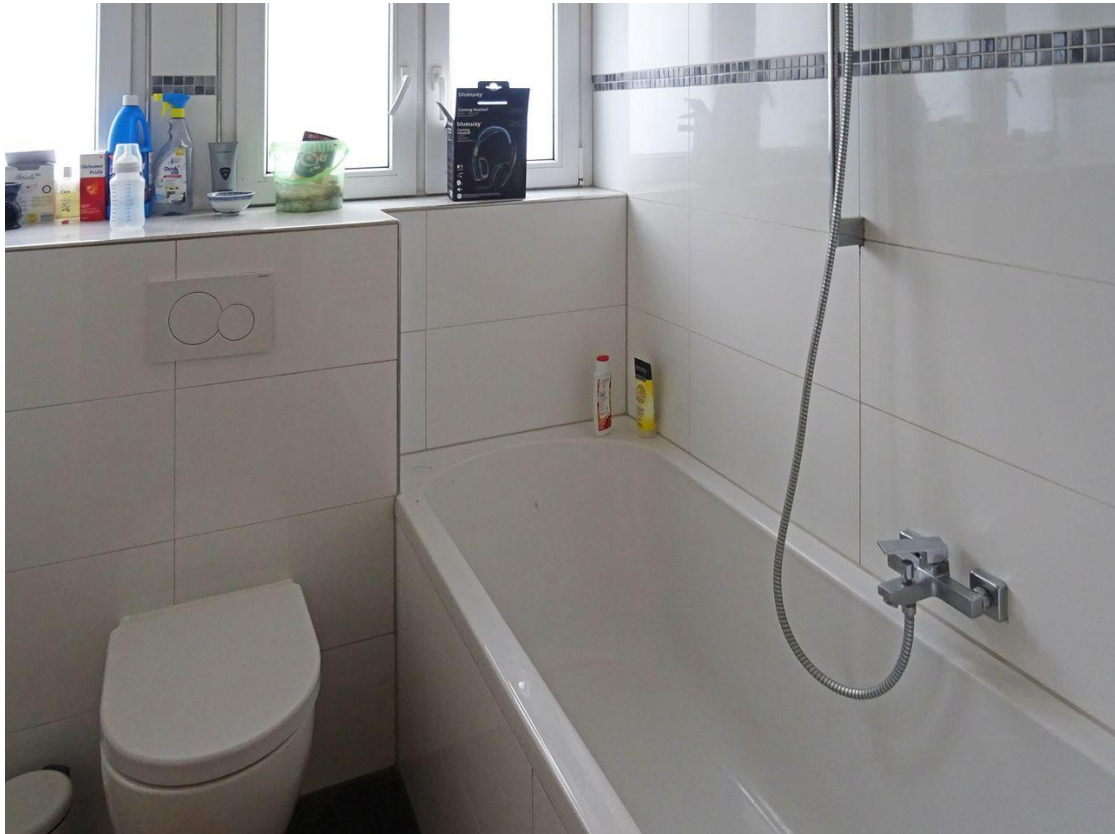
Bad mit Wanne DG