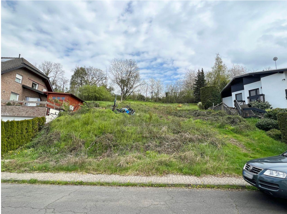
Grundstück - Ansicht von der Straße