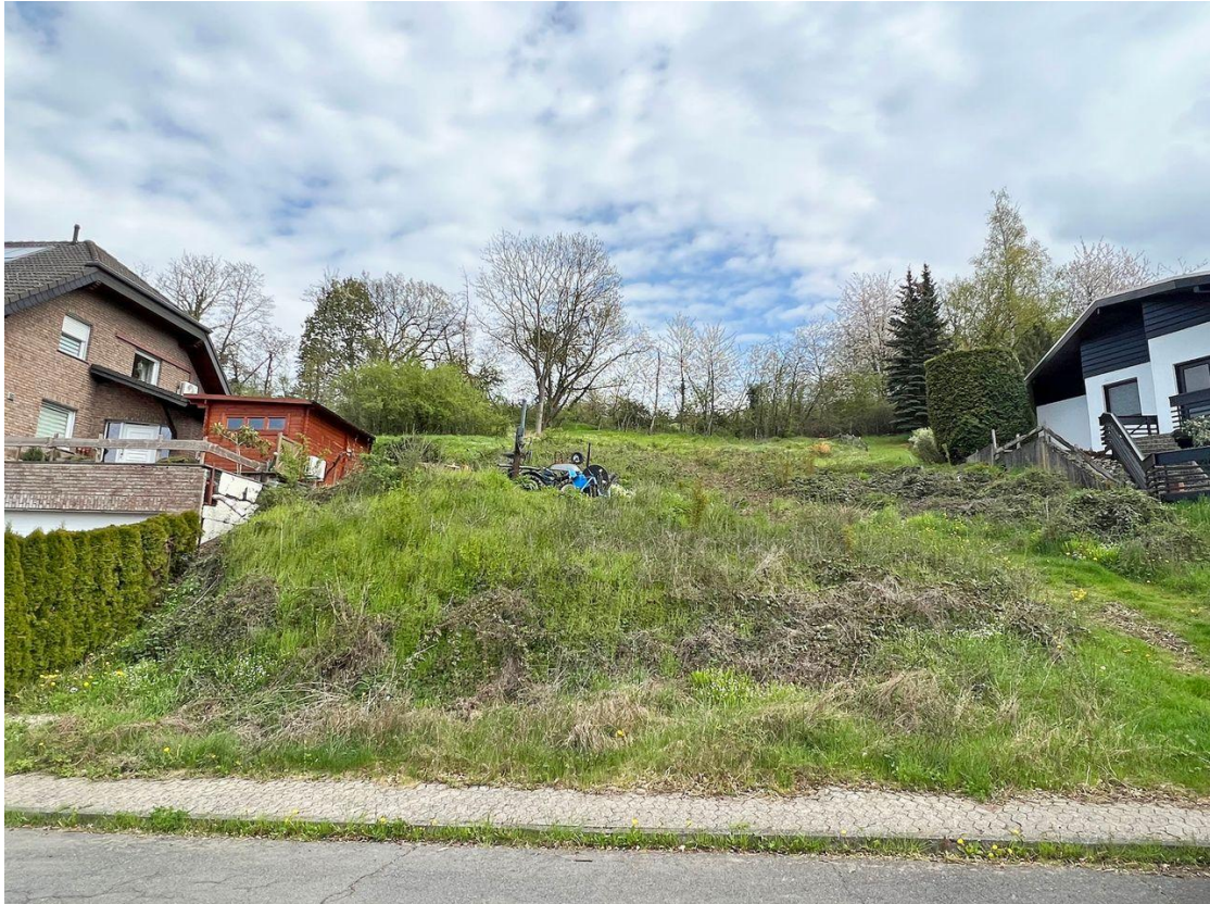
Grundstück - Ansicht von der Straße