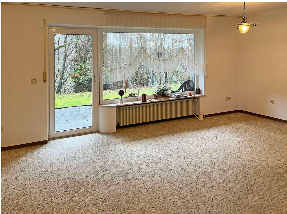
Wohnbereich , Zugang Terrasse ELW