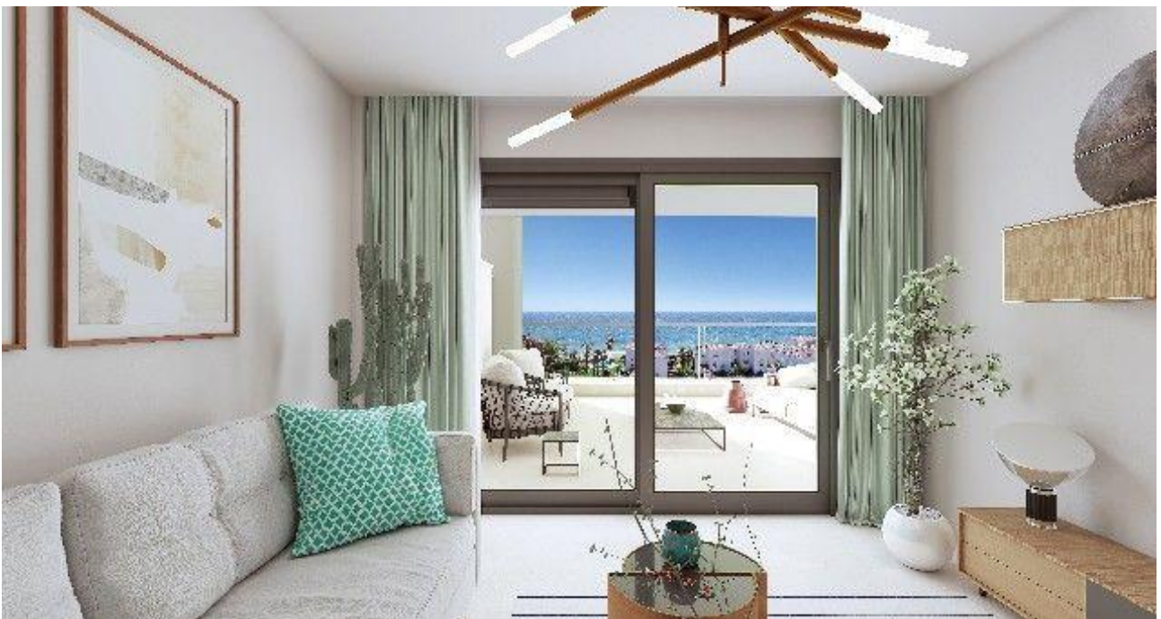
Wohnbereich mit Blick auf Terrasse