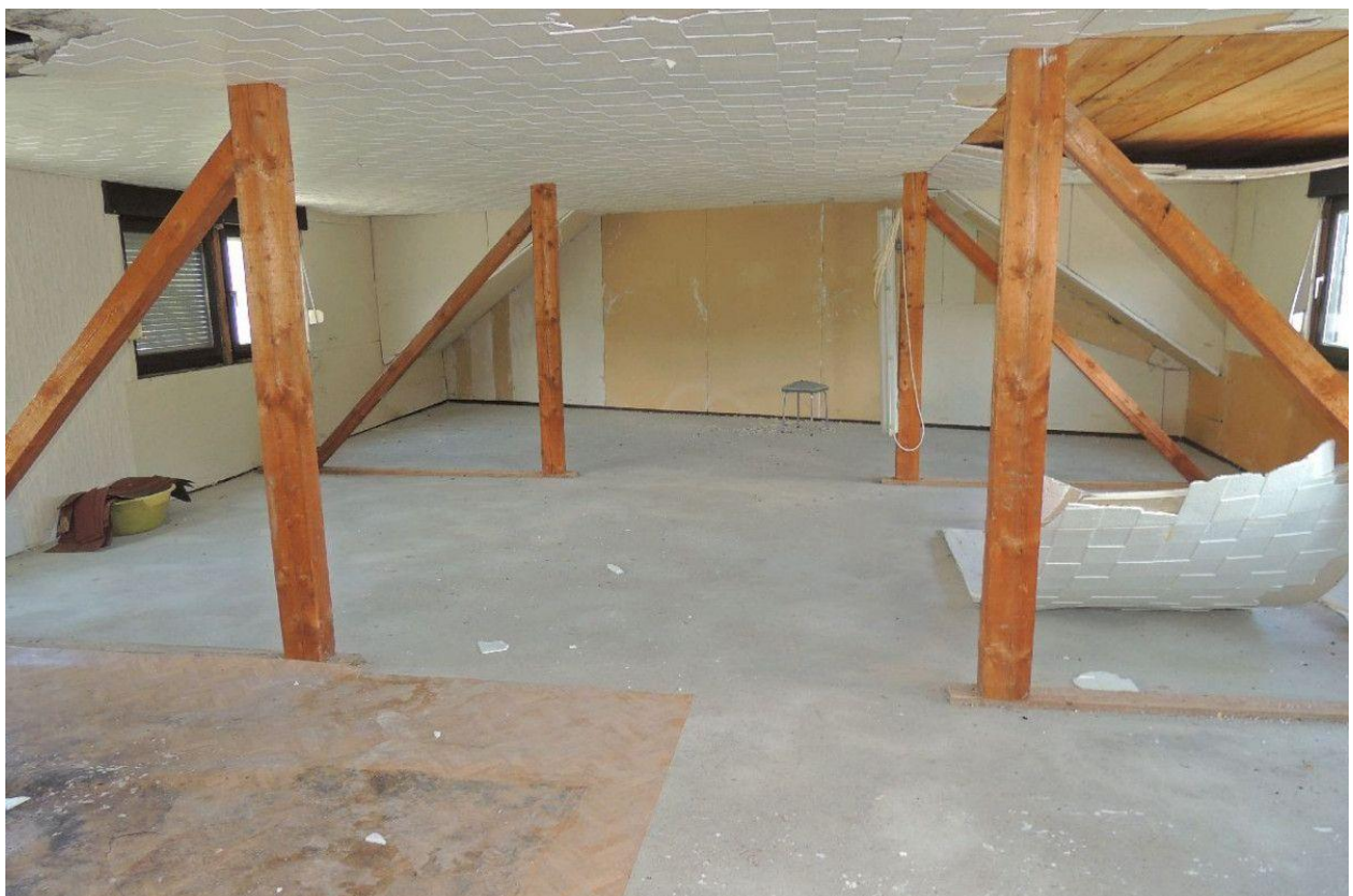
.... im Dachgeschoss