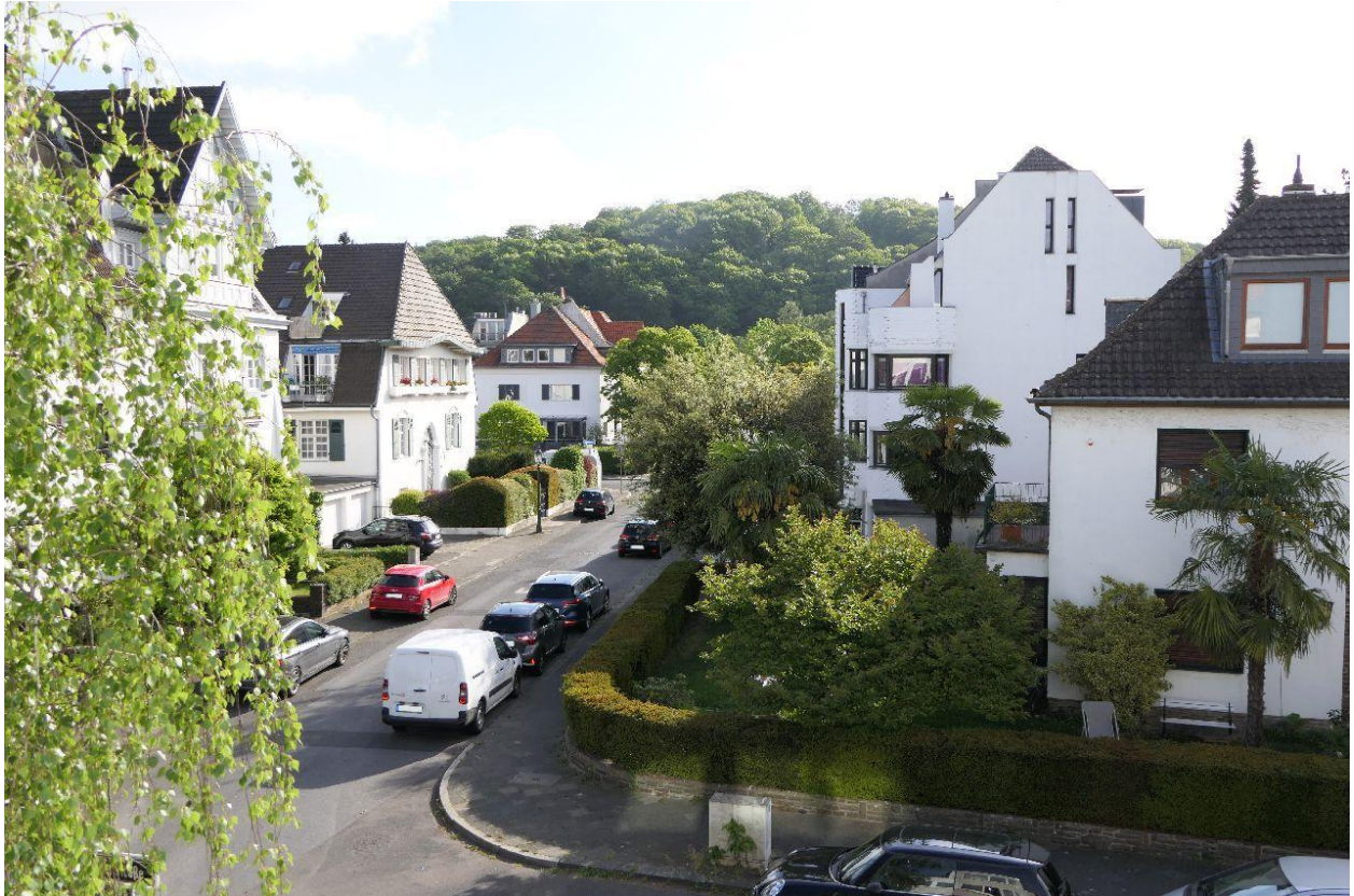
Blick auf den Grafenberger Wald